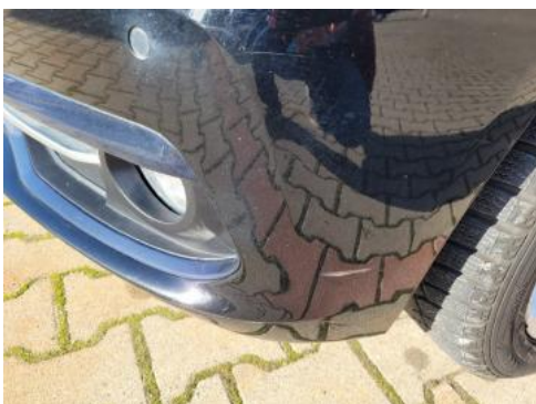
Fot. 25 Zderzak (Zdjęcie poglądowe 1)