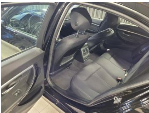
Fot. 11 Widok przez lewe tylne drzwi