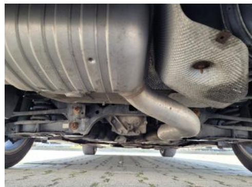
Fot. 20 Spód pojazdu tył