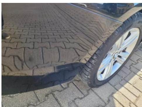
Fot. 37 Zderzak tylny (Zdjęcie poglądowe 1)