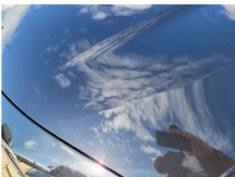
Fot. 27 Pokrywa komory silnika (Zdjęcie poglądowe 1)