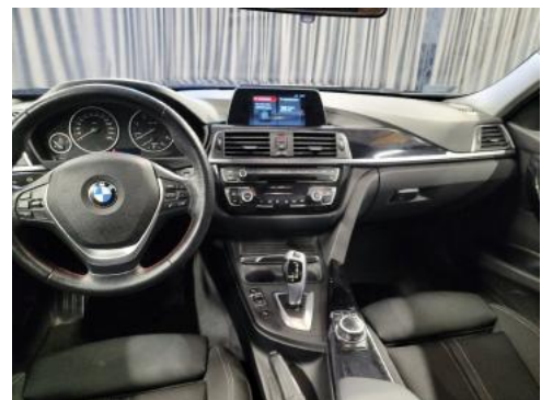
Fot. 12 Widok z tylnego siedzenia