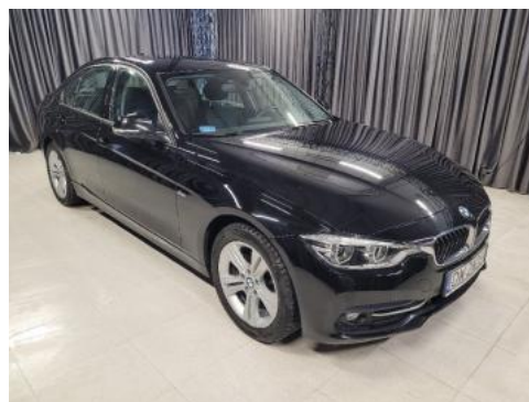
Fot. 2 Prawy bok przód