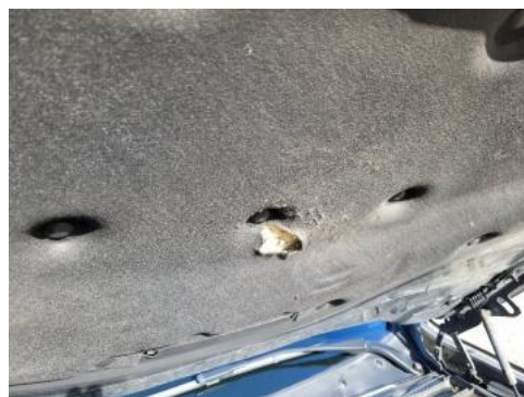
Fot. 30 Wykładzina pokrywy komory silnika (Zdjęcie poglądowe 1)