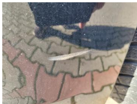
Fot. 26 Zderzak (Rysa/Odprysk)