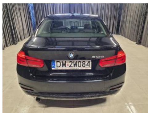
Fot. 4 Tył