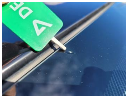
Fot. 34 Szyba czołowa (Rysa/Odprysk 1)