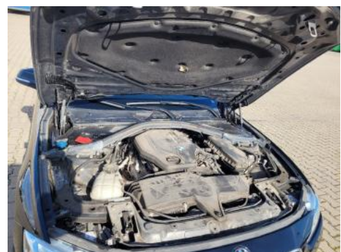
Fot. 16 Komora silnika