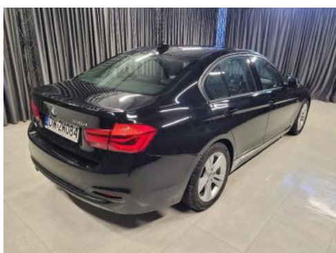
Fot. 3 Prawy bok tył