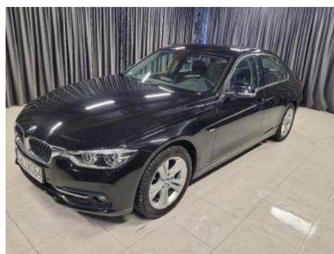
Fot. 6 Lewy bok przód