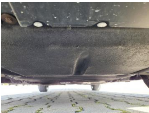
Fot. 19 Spód pojazdu przód