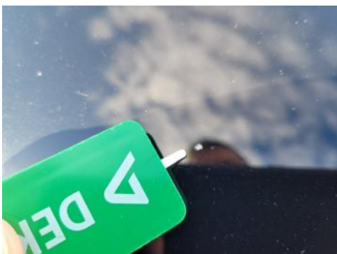
Fot. 29 Pokrywa komory silnika (Rysa/Odprysk 1)