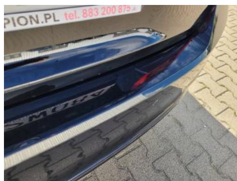
Fot. 38 Zderzak tylny (Zdjęcie poglądowe 2)