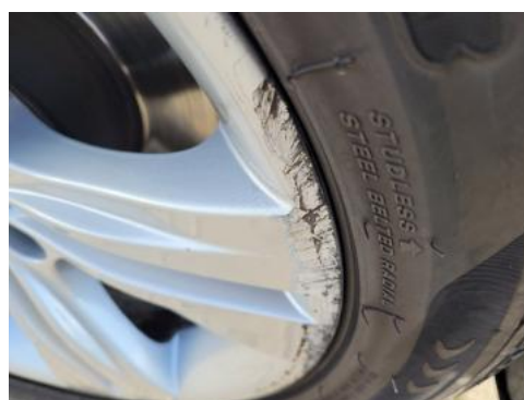
Fot. 36 Felga przednia prawa (Wgniecie./Odkształ.)