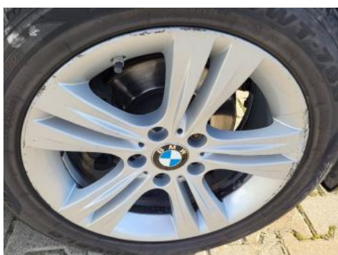
Fot. 35 Felga przednia prawa (Zdjęcie poglądowe 1)