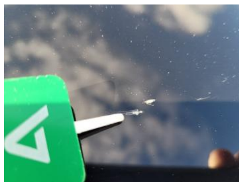
Fot. 28 Pokrywa komory silnika (Rysa/Odprysk)