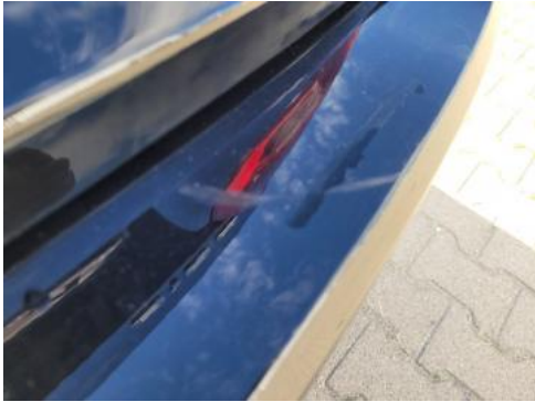
Fot. 41 Zderzak tylny (Rysa/Odprysk 2)