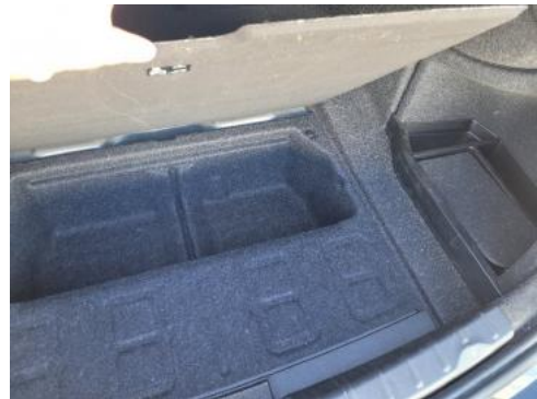
Fot. 18 Koło zapasowe/trójkąt/gaśnica