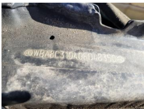
Fot. 7 Pole numerowe