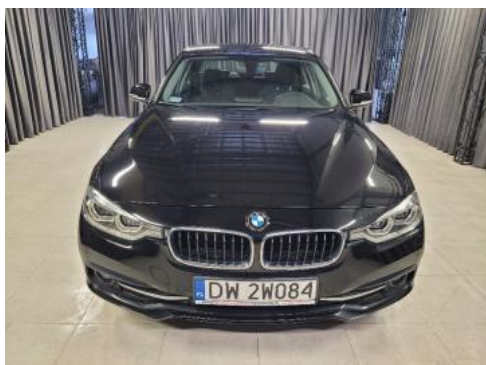
Fot. 1 Przód