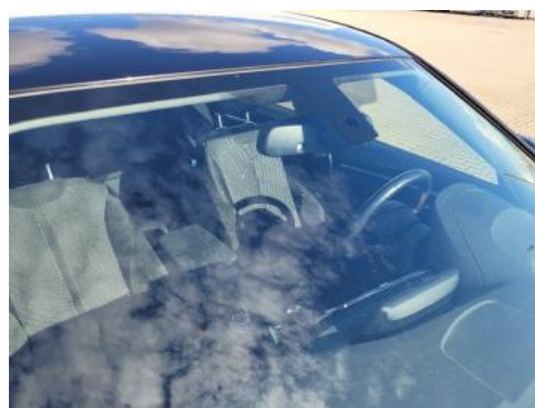
Fot. 32 Szyba czołowa (Zdjęcie poglądowe 1)