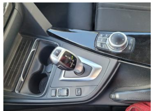
Fot. 14 Tunel środkowy