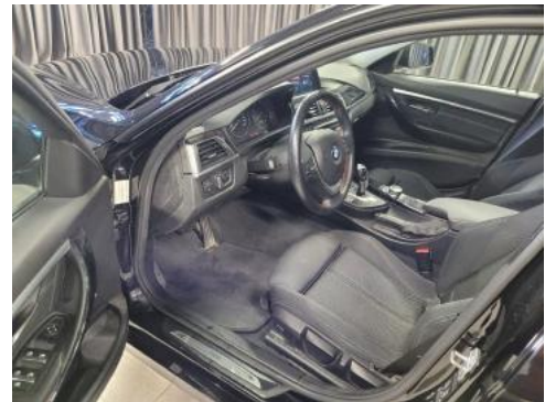
Fot. 10 Widok przez lewe przednie drzwi