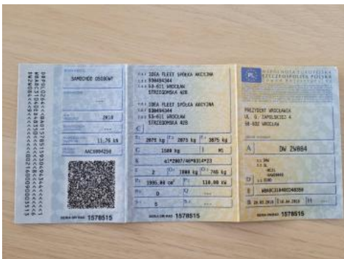
Fot. 21 Dowód rejestracyjny 1. strona