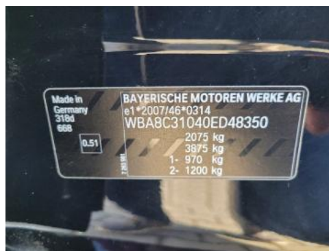
Fot. 8 Tabliczka