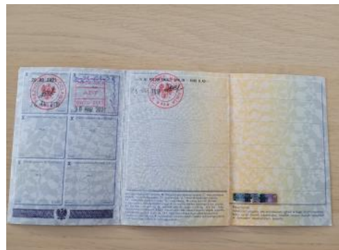
Fot. 22 Dowód rejestracyjny 2. strona / klucze