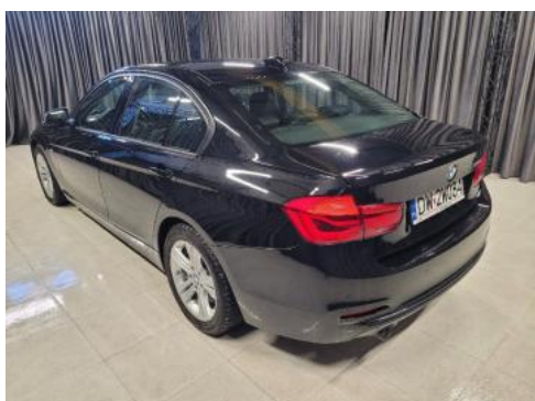
Fot. 5 Lewy bok tył