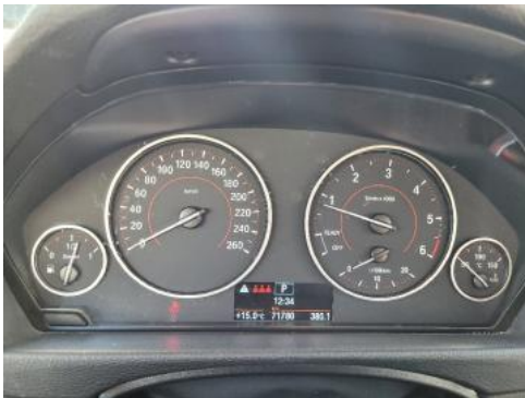
Fot. 9 Wskaźniki /przebieg/paliwo