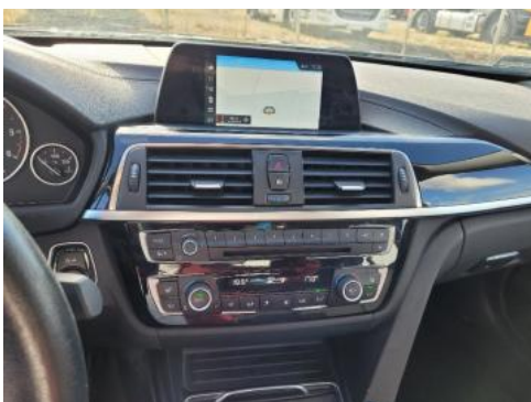
Fot. 13 Konsola środkowa