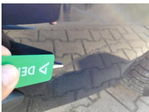
Fot. 39 Zderzak tylny (Rysa/Odprysk)