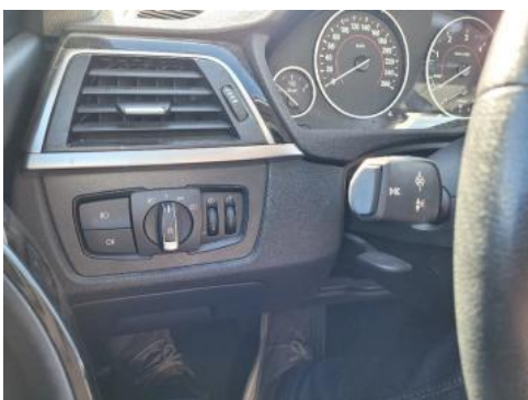
Fot. 15 Kierownica widok z lewej strony (widoczne przełączniki)