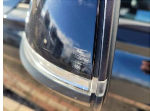
Fot. 42 Lusterko zewnętrzne lewe (Rysa/Odprysk)