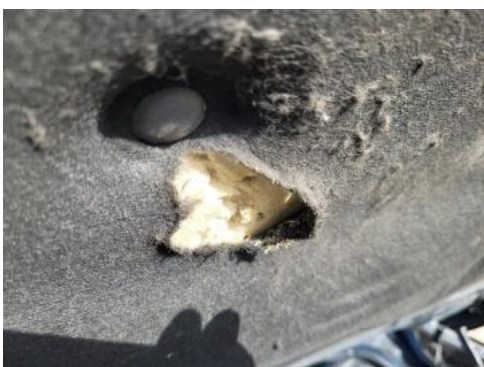
Fot. 31 Wykładzina pokrywy komory silnika (Pęknięcie/Rozerwanie)