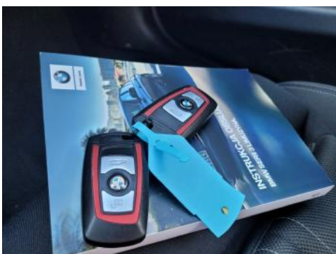
Fot. 23 Instrukcja obsługi