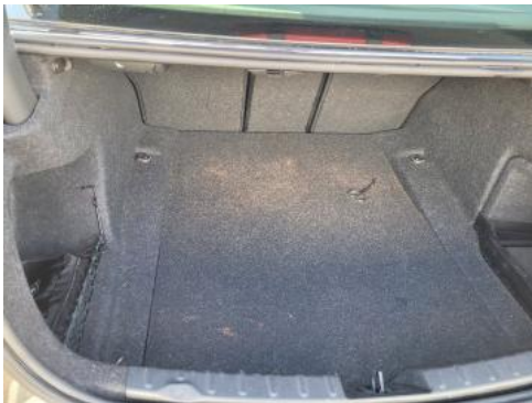
Fot. 17 Bagażnik