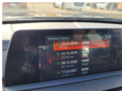
Fot. 24 Zdjęcie do protokołu