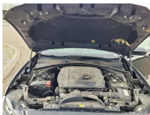
Fot. 16 Komora silnika