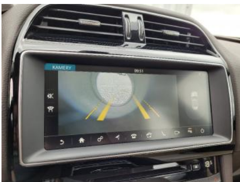
Fot. 37 Kamera