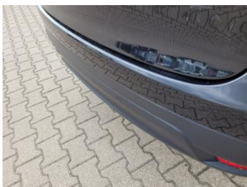
Fot. 29 Zderzak tylny (Zdjęcie pogładowe 1)