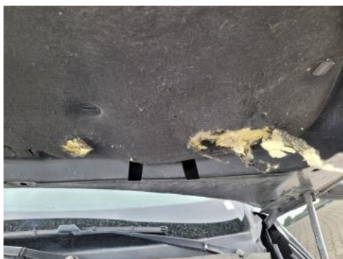
Fot. 25 Wykładzina pokrywy komory silnika (Pęknięcie/Rozerwanie)