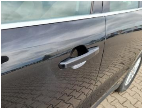
Fot. 33 Drzwi przednie lewe (Zdjęcie pogładowe 1)