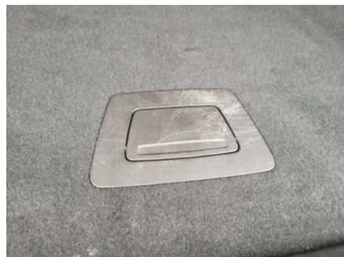
Fot. 36 Wykładzina podłogi bagażnika (Rysa/Odprysk)