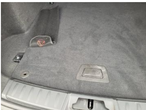
Fot. 35 Wykładzina podłogi bagażnika (Zdjęcie pogładowe 1)