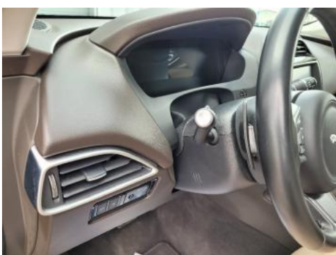
Fot. 15 Kierownica widok z lewej strony (widoczne przełączniki)