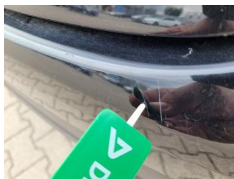
Fot. 30 Zderzak tylny (Rysa/Odprysk)