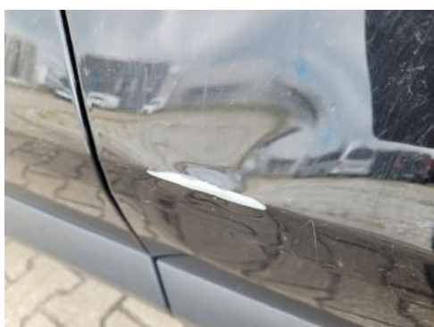
Fot. 27 Drzwi przednie prawe (Wgniec./Odształ.)