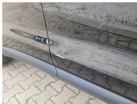
Fot. 26 Drzwi przednie prawe (Zdjęcie pogładowe 1)