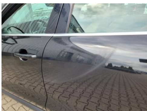
Fot. 31 Drzwi tylne lewe (Zdjęcie pogładowe 1)