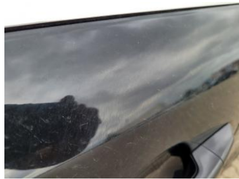
Fot. 34 Drzwi przednie lewe (Rysa/Odprysk)