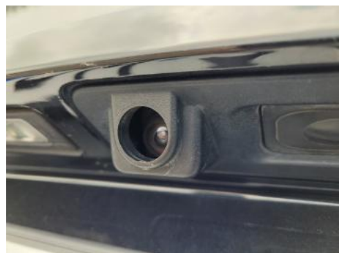
Fot. 38 Kamera_1