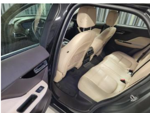
Fot. 11 Widok przez lewe tylne drzwi