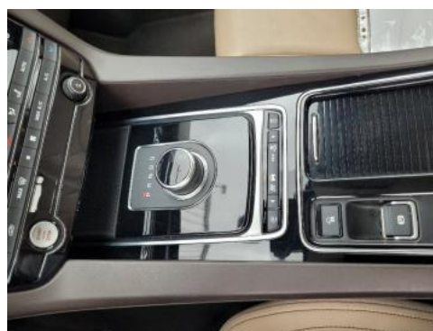
Fot. 14 Tunel środkowy