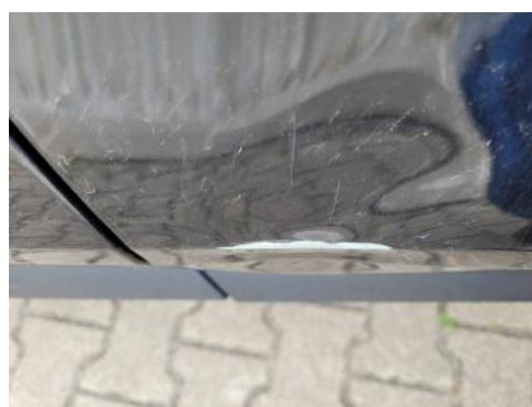
Fot. 28 Drzwi przednie prawe (Wgniec./Odształ. 1)