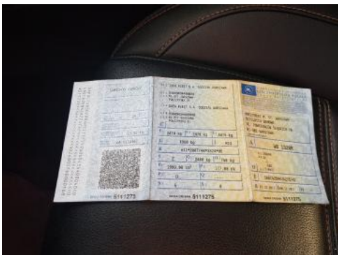
Fot. 21 Dowód rejestracyjny 1. strona