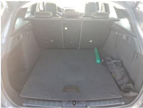
Fot. 17 Bagażnik