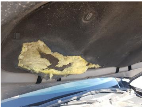
Fot. 27 Wykładzina pokrywy komory silnika (Pęknięcie/Rozerwanie)