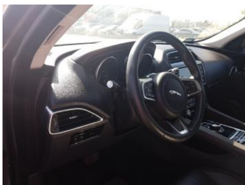
Fot. 15 Kierownica widok z lewej strony (widoczne przełączniki)