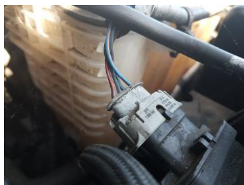
Fot. 38 Poziom cieczy chłodzącej poniżej minimum.