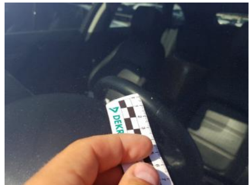
Fot. 28 Szyba czołowa (Rysa/Odprysk)