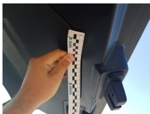
Fot. 36 Wykładzina pokrywy tylnej (Rysa/Odprysk)