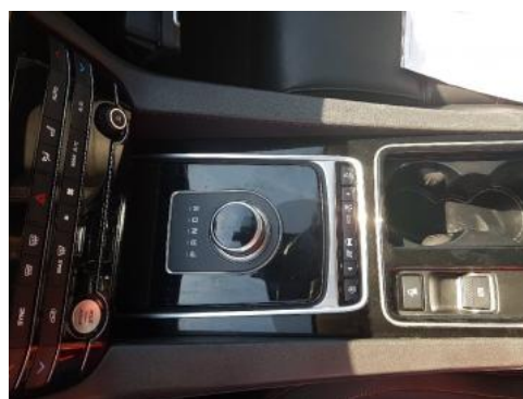
Fot. 14 Tunel środkowy