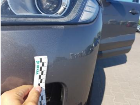
Fot. 25 Zderzak (Rysa/Odprysk 1)