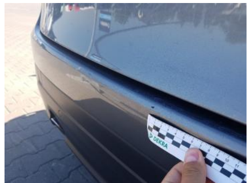
Fot. 30 Zderzak tylny (Rysa/Odprysk)