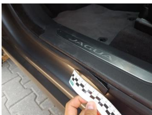
Fot. 35 Uszczelka drzwi przednich lewych (Pęknięcie/Rozerwanie)