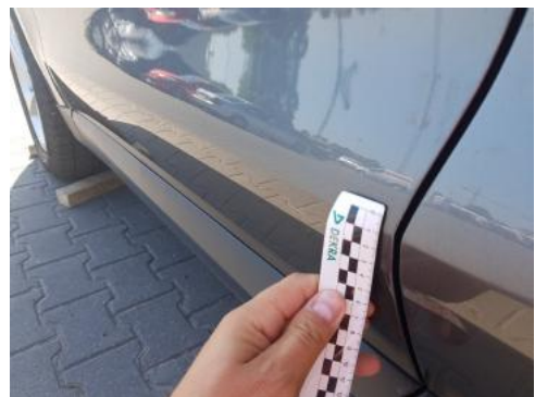
Fot. 32 Drzwi przednie lewe (Rysa/Odprysk)