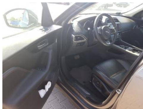
Fot. 10 Widok przez lewe przednie drzwi