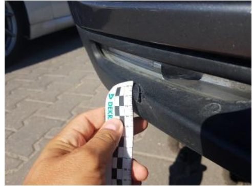
Fot. 26 Spoiler zderzaka przedniego (Pęknięcie/Rozerwanie)