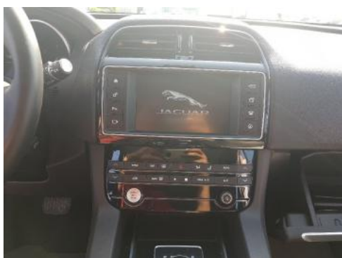
Fot. 13 Konsola środkowa