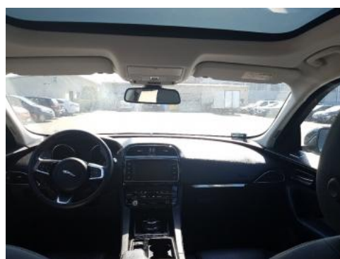
Fot. 12 Widok z tylnego siedzenia