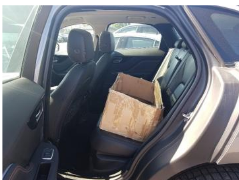
Fot. 11 Widok przez lewe tylne drzwi