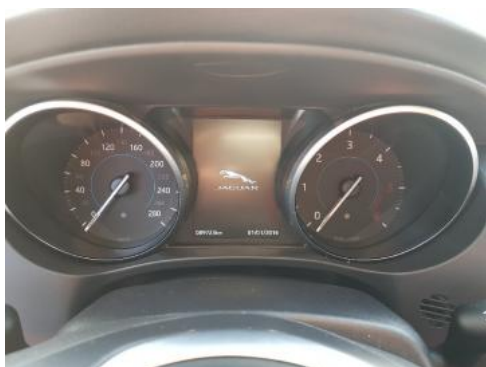
Fot. 9 Wskaźniki /przebieg/paliwo