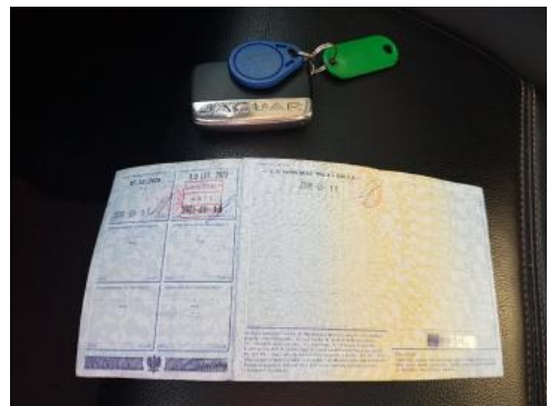
Fot. 22 Dowód rejestracyjny 2. strona / klucze