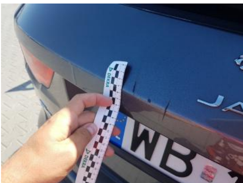
Fot. 31 Pokrywa bagażnika (Rysa/Odprysk)