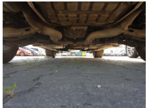
Fot. 20 Spód pojazdu tył