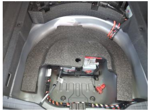
Fot. 18 Koło zapasowe/trójkąt/gaśnica