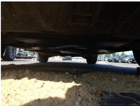
Fot. 19 Spód pojazdu przód