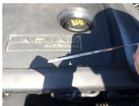
Fot. 40 Poziom oleju poniżej minimum.