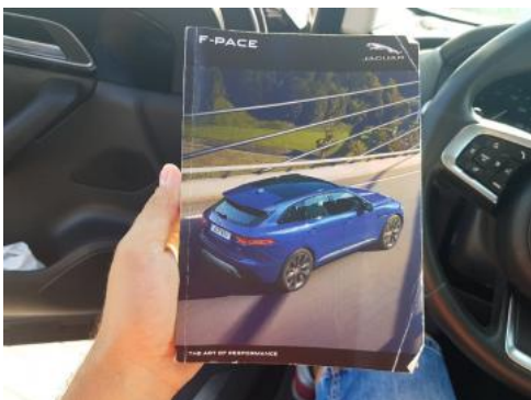
Fot. 23 Instrukcja obsługi