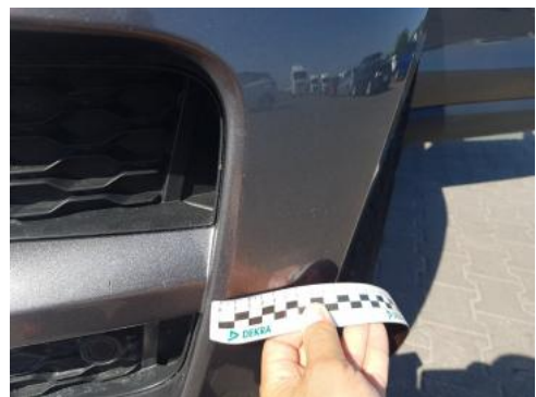
Fot. 24 Zderzak (Rysa/Odprysk)