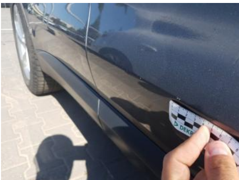
Fot. 29 Drzwi przednie prawe (Rysa/Odprysk)