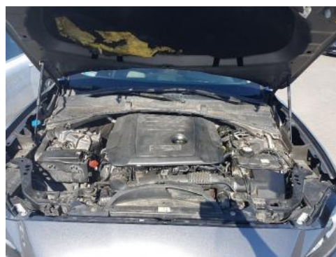
Fot. 16 Komora silnika