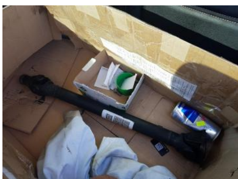
Fot. 39 Wał napędowy zdemontowany