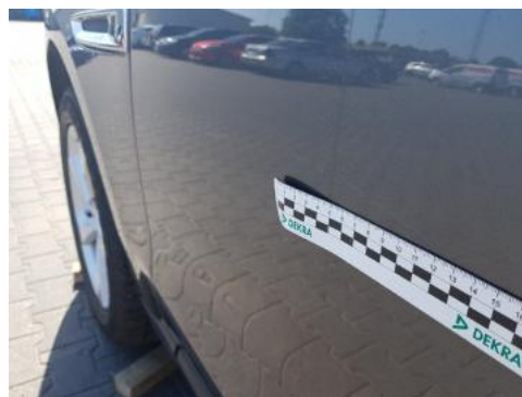
Fot. 34 Drzwi przednie lewe (Rysa/Odprysk 2)