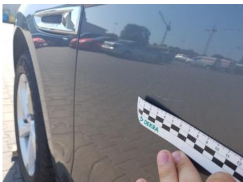
Fot. 33 Drzwi przednie lewe (Rysa/Odprysk 1)