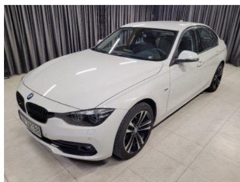
Fot. 6 Lewy bok przód