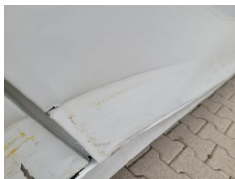
Fot. 32 Drzwi tylne prawe (Wgniecie./Odkształ.)