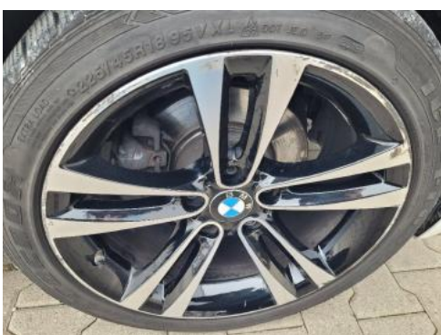
Fot. 27 Felga przednia prawa (Zdjęcie poglądowe 1)