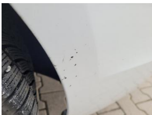
Fot. 37 Zderzak tylny (Inne)