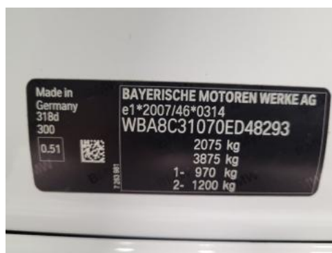
Fot. 8 Tabliczka