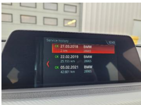
Fot. 23 Książka serwisowa - ostatni przegląd