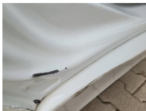
Fot. 30 Próg prawy (Wgniecie./Odkształ.)