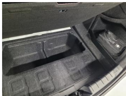
Fot. 18 Koło zapasowe/trójkąt/gaśnica