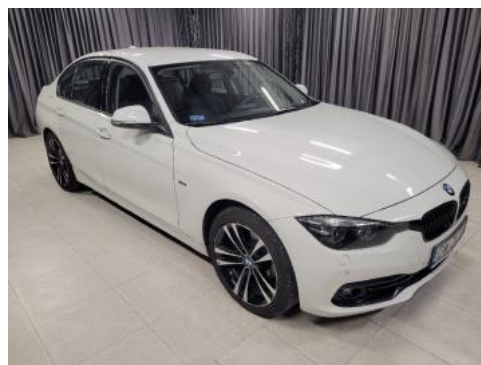
Fot. 2 Prawy bok przód