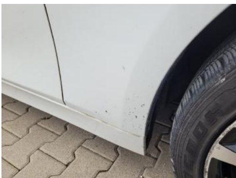
Fot. 25 Błotnik przedni prawy (Zdjęcie poglądowe 1)