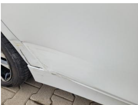
Fot. 31 Drzwi tylne prawe (Zdjęcie poglądowe 1)