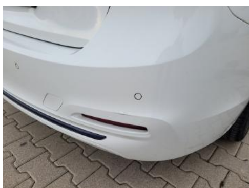
Fot. 35 Zderzak tylny (Zdjęcie poglądowe 1)