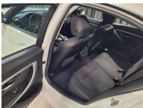
Fot. 11 Widok przez lewe tylne drzwi