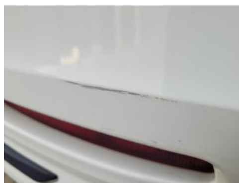
Fot. 36 Zderzak tylny (Rysa/Odprysk)