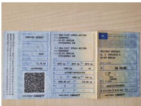
Fot. 21 Dowód rejestracyjny 1. strona