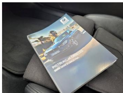
Fot. 24 Instrukcja obsługi