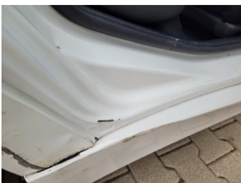
Fot. 29 Próg prawy (Zdjęcie poglądowe 1)