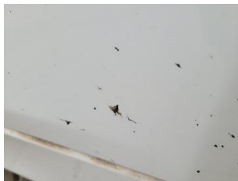
Fot. 26 Błotnik przedni prawy (Inne)