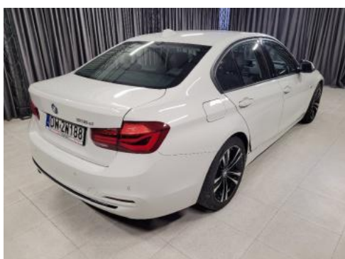
Fot. 3 Prawy bok tył