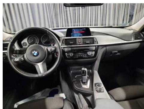
Fot. 12 Widok z tylnego siedzenia