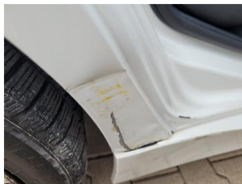
Fot. 34 Błotnik tylny prawy/ściana boczna prawa (Wgniecie./Odształ.)