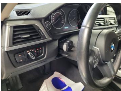
Fot. 15 Kierownica widok z lewej strony (widoczne przełączniki)