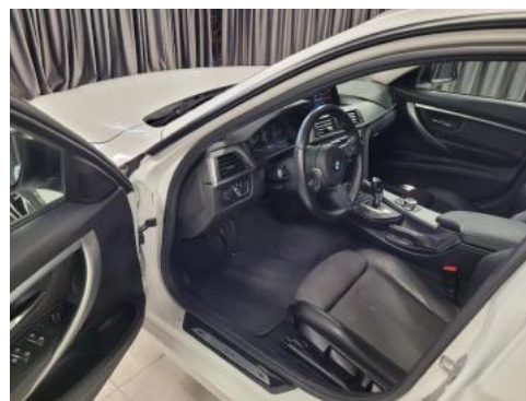
Fot. 10 Widok przez lewe przednie drzwi