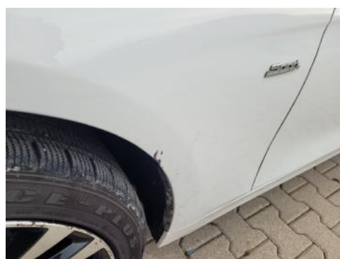
Fot. 40 Błotnik przedni lewy (Zdjęcie poglądowe 1)