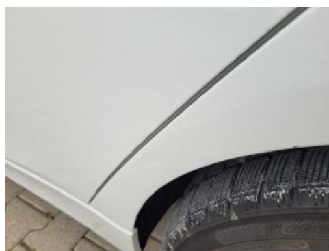
Fot. 38 Błotnik tylny lewy/ściana boczna lewa (Zdjęcie poglądowe 1)