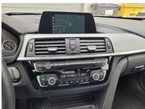
Fot. 13 Konsola środkowa