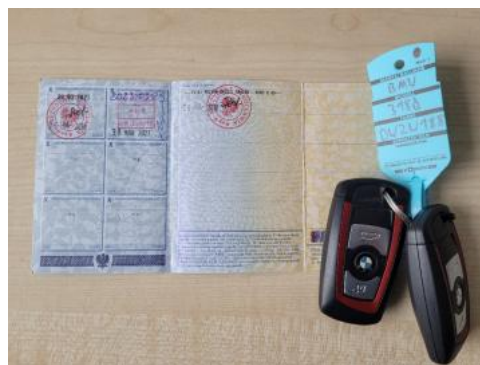
Fot. 22 Dowód rejestracyjny 2. strona / klucze