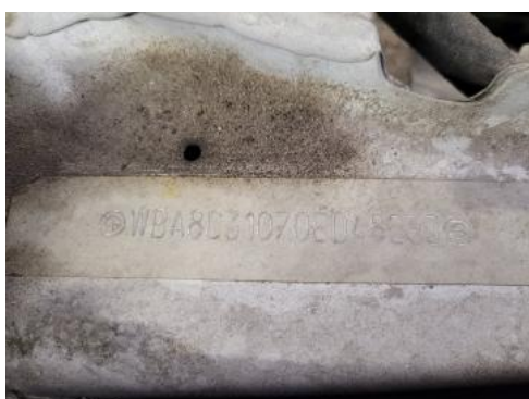
Fot. 7 Pole numerowe