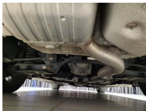
Fot. 20 Spód pojazdu tył