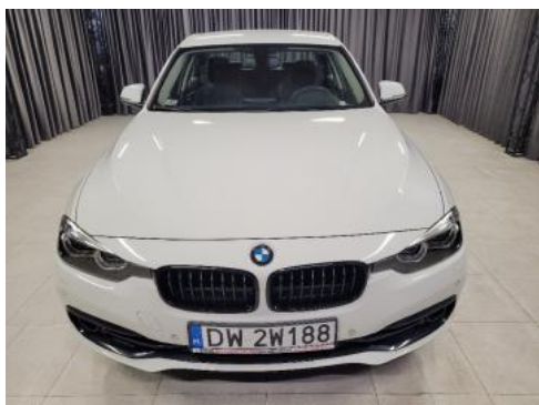
Fot. 1 Przód