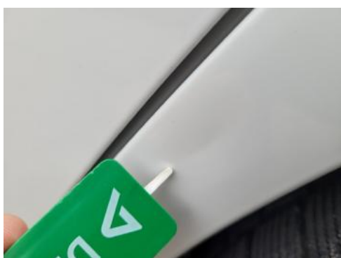
Fot. 39 Błotnik tylny lewy/ściana boczna lewa (Wgniecie./Odształ.)