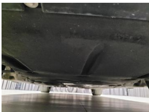
Fot. 19 Spód pojazdu przód