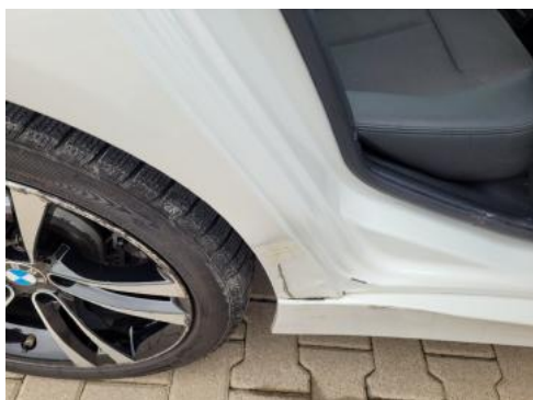
Fot. 33 Błotnik tylny prawy/ściana boczna prawa (Zdjęcie poglądowe 1)