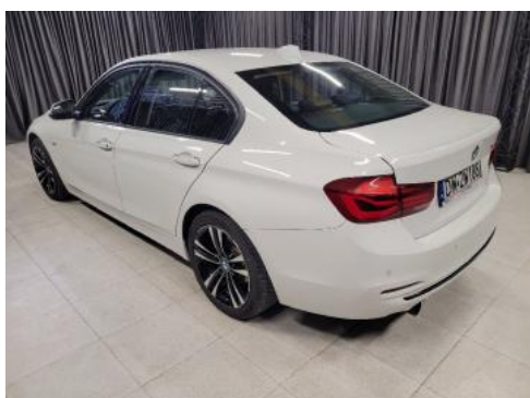
Fot. 5 Lewy bok tył