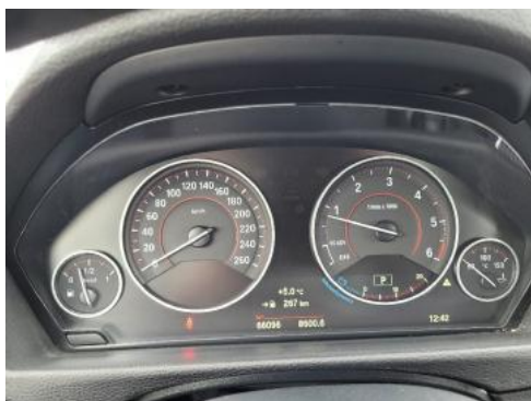
Fot. 9 Wskaźniki /przebieg/paliwo