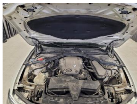
Fot. 16 Komora silnika