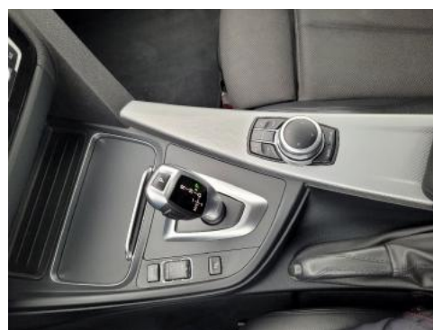
Fot. 14 Tunel środkowy