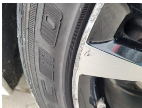
Fot. 28 Felga przednia prawa (Rysa/Odprysk)