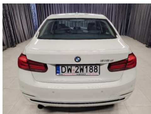
Fot. 4 Tył