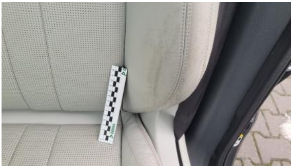
Fot. 45 Fotel lewy (Inne)