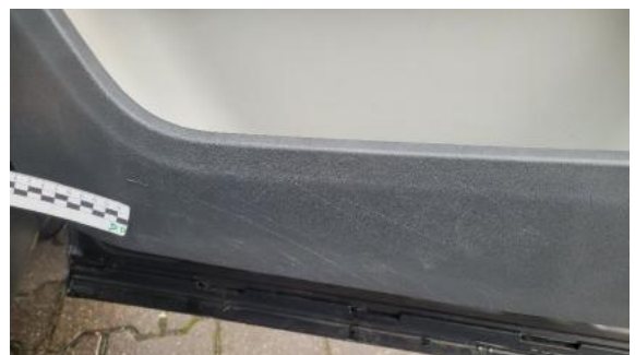
Fot. 48 Tapicerka drzwi przednich prawych (Rysa/Odprysk)