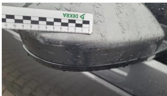
Fot. 30 Lusterko zewnętrzne prawe (Rysa/Odprysk)