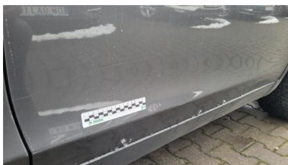
Fot. 32 Drzwi przednie prawe (Rysa/Odprysk 1)