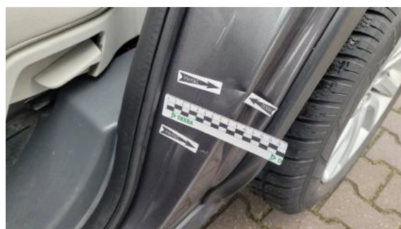
Fot. 40 Błotnik tylny lewy/ściana boczna lewa (Wgniec./Odkształ.)