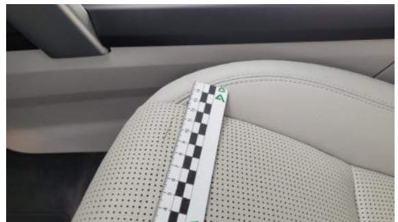
Fot. 44 Fotel lewy (Rysa/Odprysk)