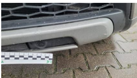
Fot. 27 Spoiler zderzaka przedniego (Inne)