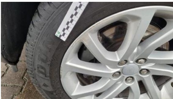
Fot. 43 Felga przednia lewa (Rysa/Odprysk)