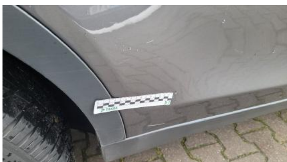
Fot. 35 Drzwi tylne prawe (Rysa/Odprysk 1)