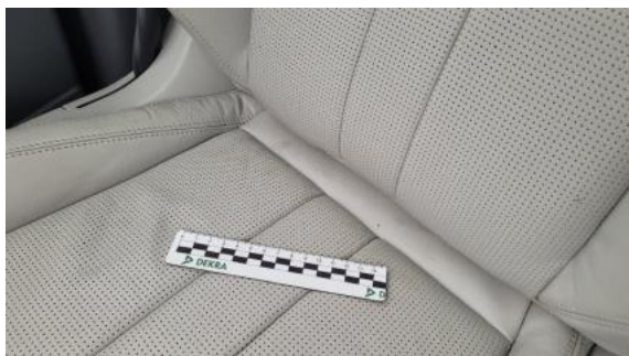
Fot. 49 Fotel prawy (Inne)