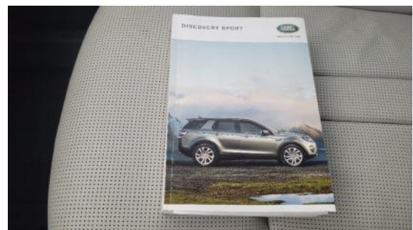
Fot. 24 Instrukcja obsługi