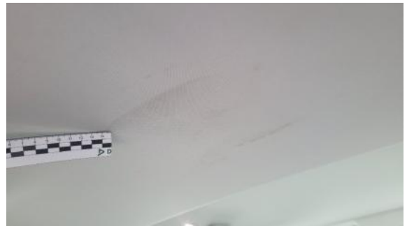
Fot. 46 Podsufitka (Inne)