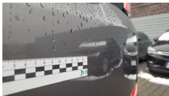
Fot. 38 Pokrywa bagażnika (Rysa/Odprysk)