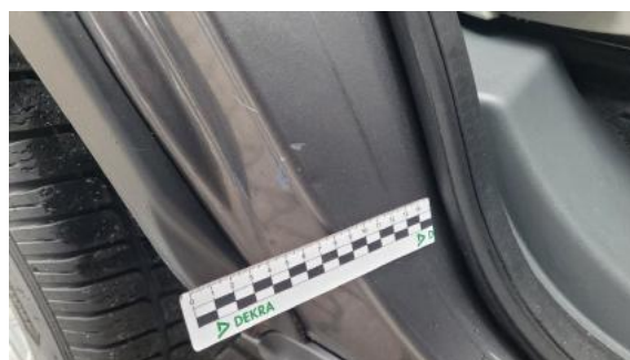
Fot. 36 Błotnik tylny prawy/ściana boczna prawa (Rysa/Odprysk)