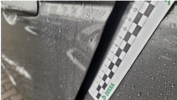
Fot. 41 Drzwi tylne lewe (Rysa/Odprysk)