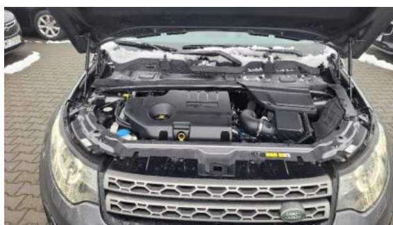
Fot. 16 Komora silnika