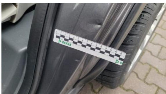
Fot. 39 Błotnik tylny lewy/ściana boczna lewa (Rysa/Odprysk)