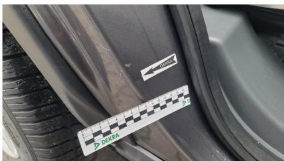
Fot. 37 Błotnik tylny prawy/ściana boczna prawa (Wgniec./Odkształ.)