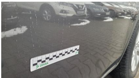
Fot. 33 Drzwi przednie prawe (Rysa/Odprysk 2)