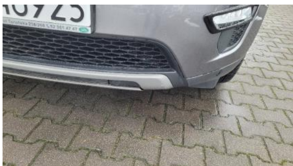
Fot. 25 Spoiler zderzaka przedniego (Zdjęcie poglądowe 1)