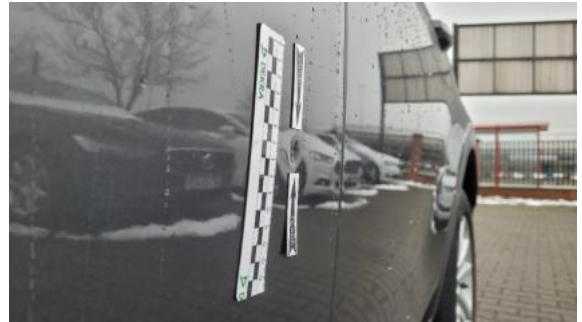
Fot. 42 Drzwi przednie lewe (Wgniec./Odształ.)