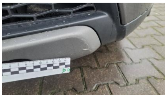
Fot. 26 Spoiler zderzaka przedniego (Rysa/Odprysk)