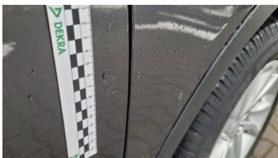
Fot. 31 Drzwi przednie prawe (Rysa/Odprysk)