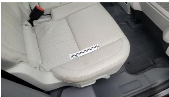
Fot. 47 Kanapa tylna (Inne)