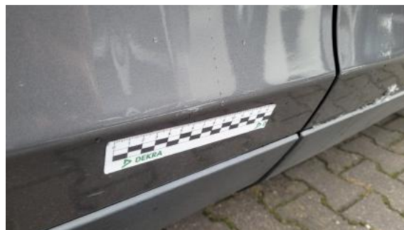
Fot. 34 Drzwi tylne prawe (Rysa/Odprysk)