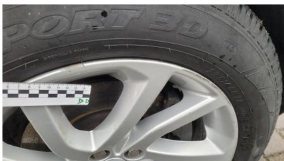
Fot. 29 Felga przednia prawa (Rysa/Odprysk)