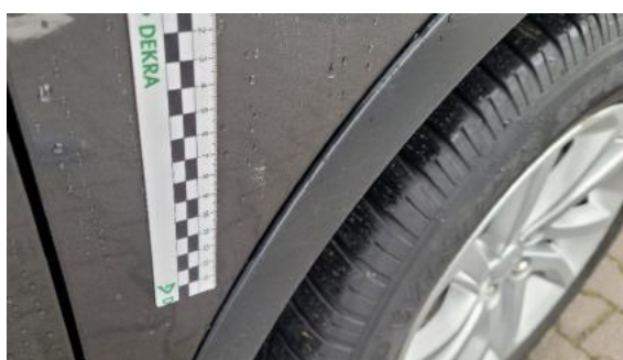
Fot. 28 Błotnik przedni prawy (Rysa/Odprysk)