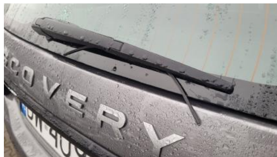
Fot. 50 Pióro wycieraczki szyby tylnej