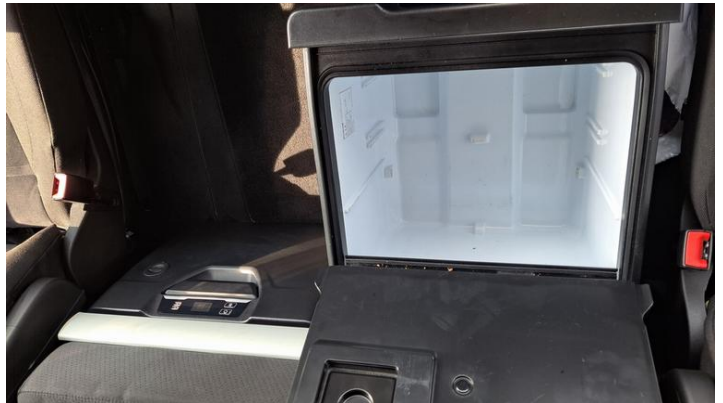
Fot. nr 34