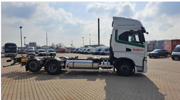
Fot. nr 5