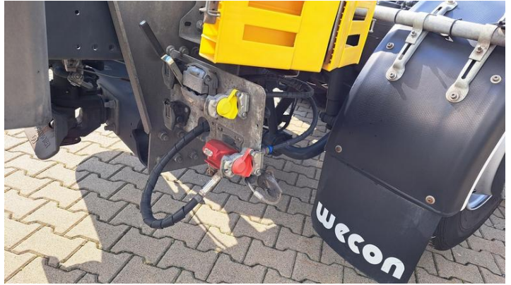
Fot. nr 12