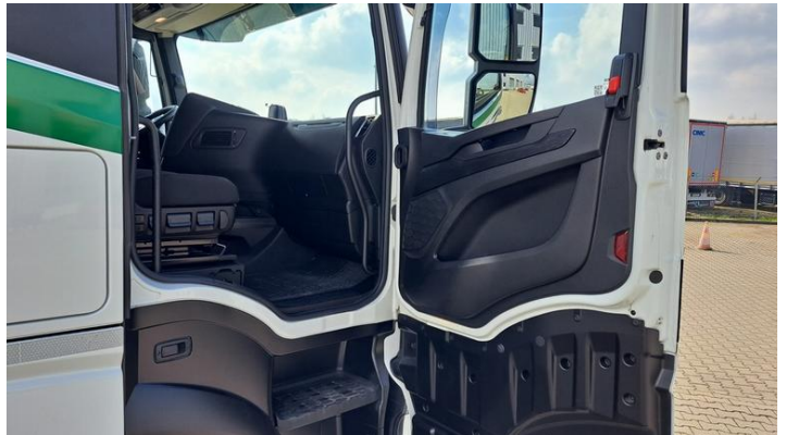
Fot. nr 22