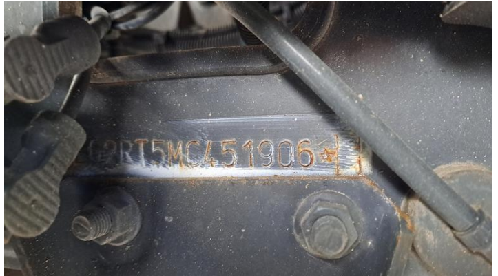
Fot. nr 16