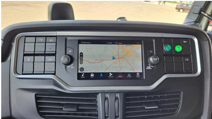
Fot. nr 37