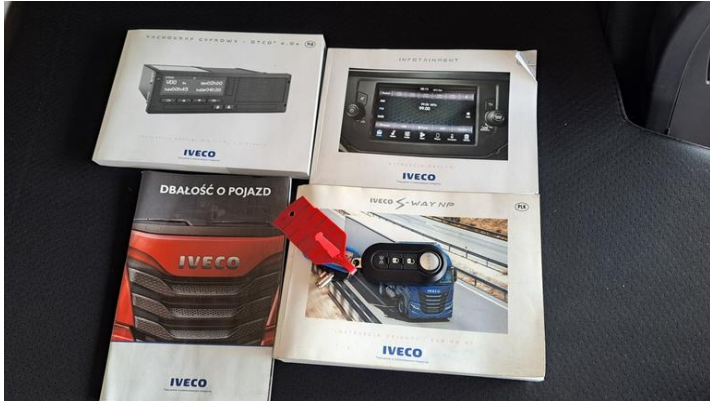
Fot. nr 35