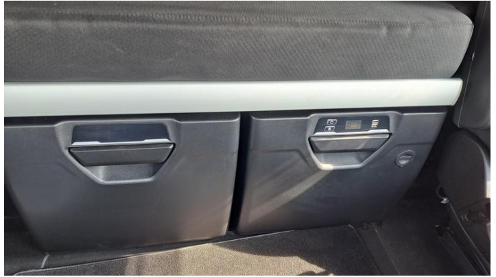
Fot. nr 32