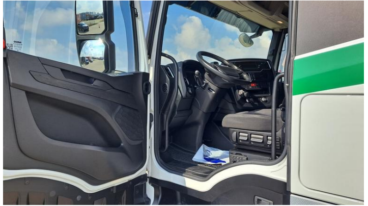
Fot. nr 28