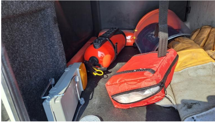
Fot. nr 27