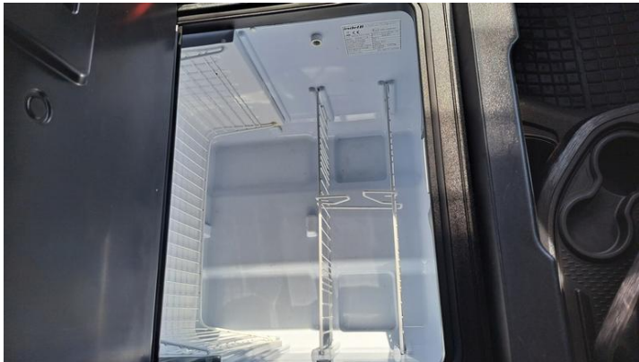
Fot. nr 33