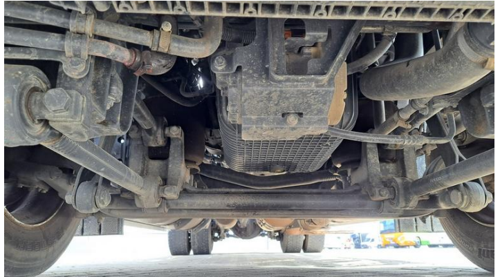
Fot. nr 20