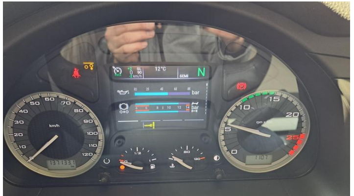
Fot. nr 38