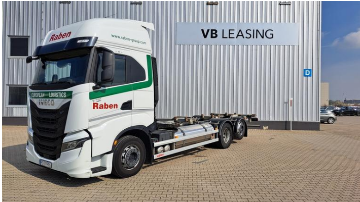
Fot. nr 1