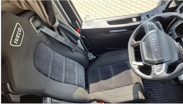
Fot. nr 31