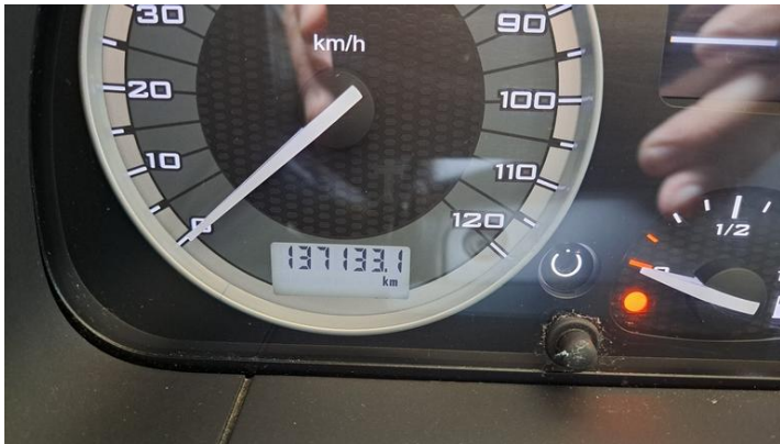
Fot. nr 39

Dokument wystawiony elektronicznie, ważny bez podpisu