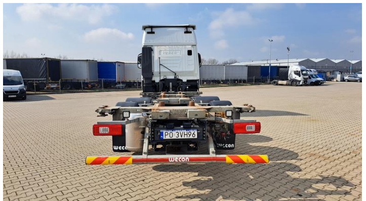
Fot. nr 6