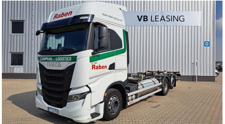
Fot. nr 2