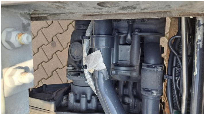
Fot. nr 21