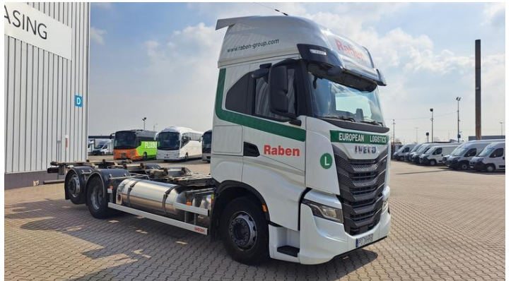
Fot. nr 4