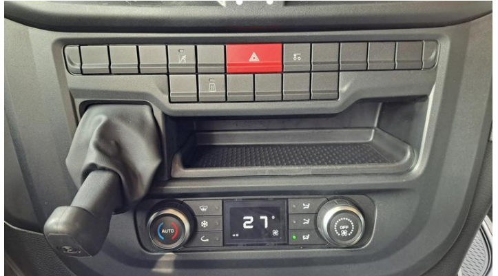
Fot. nr 36