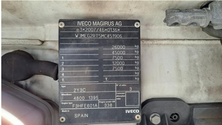
Fot. nr 19