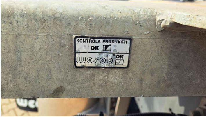
Fot. nr 11