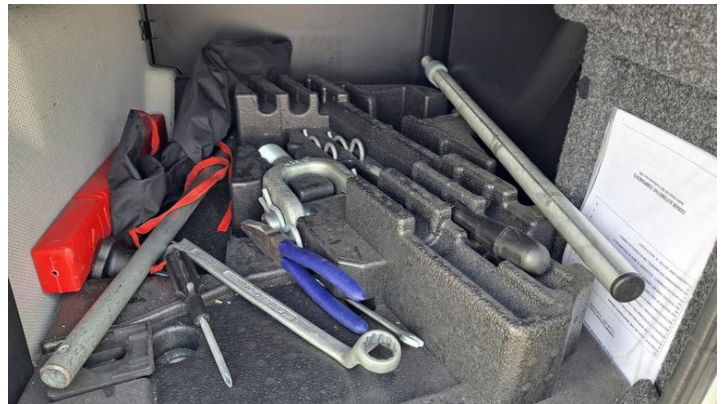
Fot. nr 24