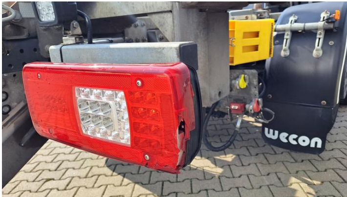
Fot. nr 13