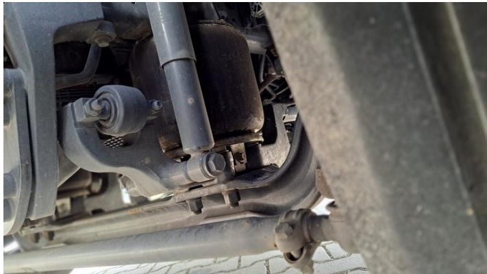
Fot. nr 17