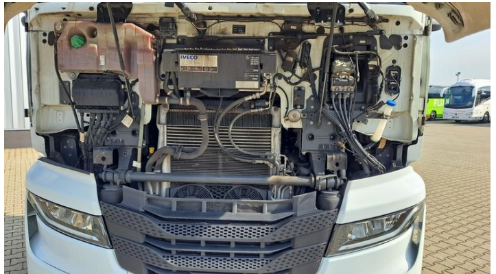
Fot. nr 18