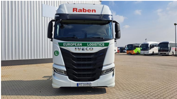
Fot. nr 3