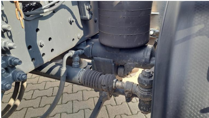
Fot. nr 9