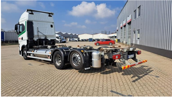
Fot. nr 7