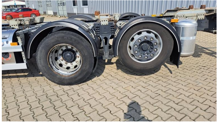
Fot. nr 8