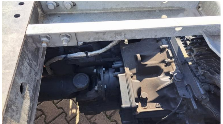
Fot. nr 14