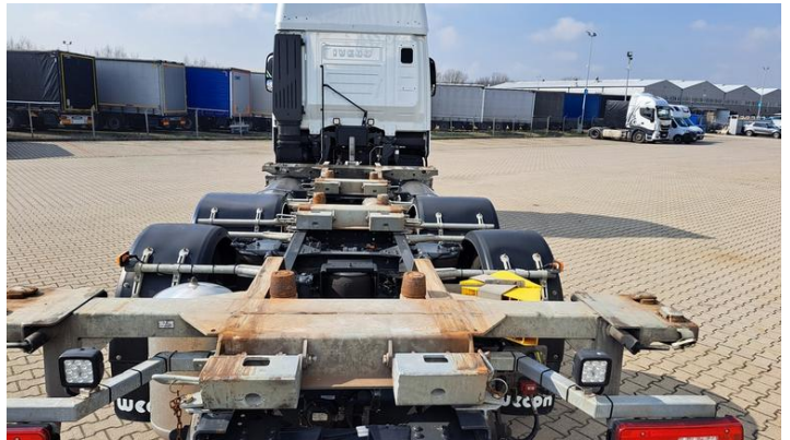
Fot. nr 10