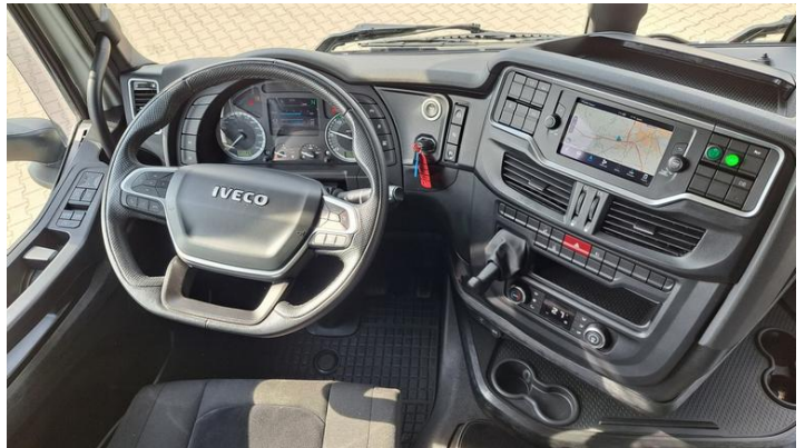
Fot. nr 30