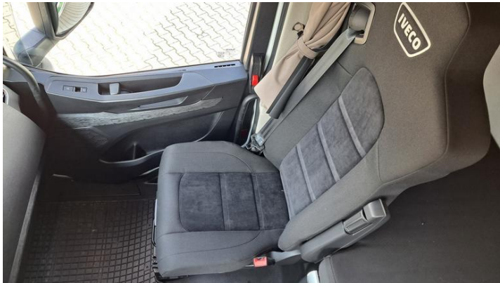
Fot. nr 29