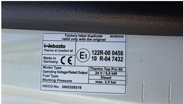
Fot. nr 23