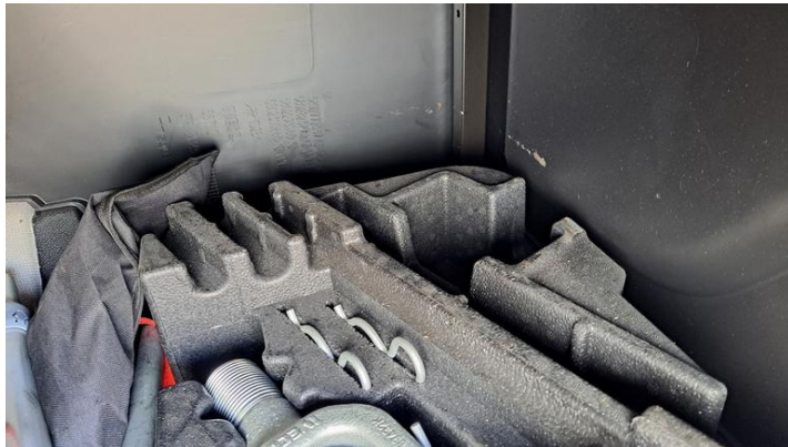
Fot. nr 25