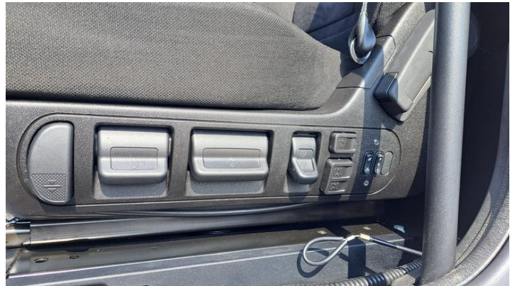
Fot. nr 26