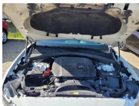
Fot. 16 Komora silnika