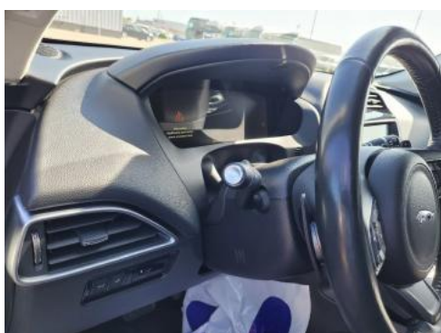
Fot. 15 Kierownica widok z lewej strony (widoczne przełączniki)