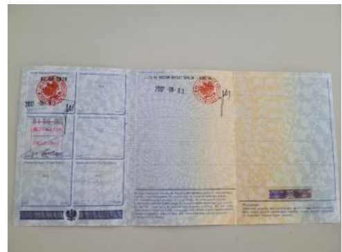
Fot. 22 Dowód rejestracyjny 2. strona / klucze