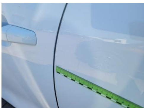
Fot. 37 Drzwi tylne lewe (Zdjęcie pogładowe 2)