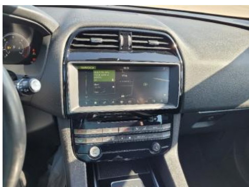
Fot. 13 Konsola środkowa