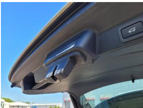
Fot. 43 Wykładzina pokrywy tylnej (Zdjęcie pogładowe 1)