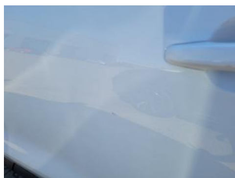
Fot. 36 Drzwi tylne lewe (Zdjęcie pogładowe 1)