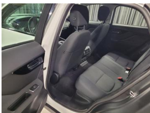
Fot. 11 Widok przez lewe tylne drzwi