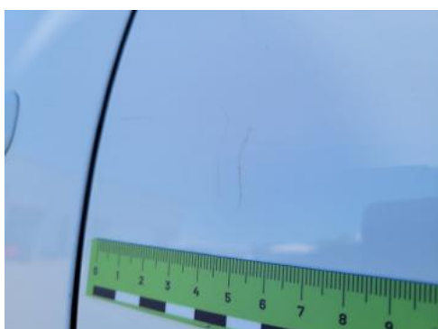
Fot. 39 Drzwi tylne lewe (Rysa/Odprysk 1)