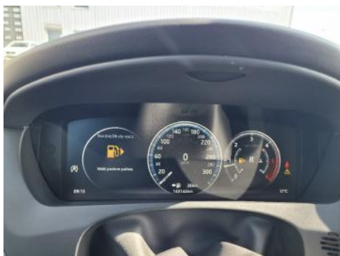
Fot. 9 Wskaźniki /przebieg/paliwo