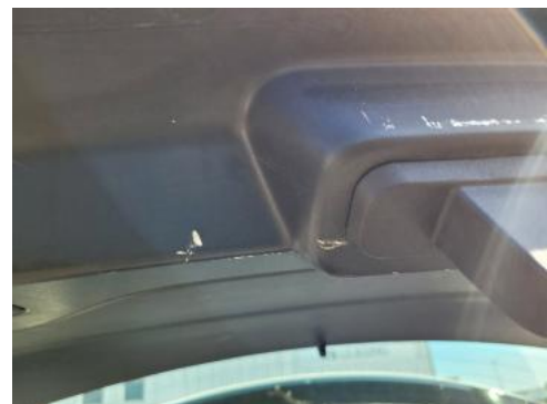
Fot. 44 Wykładzina pokrywy tylnej (Rysa/Odprysk)