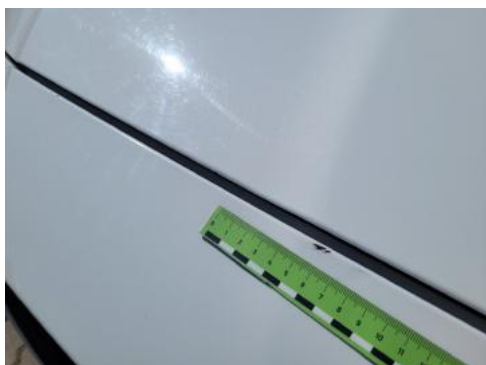
Fot. 25 Zderzak (Zdjęcie poglądowe 2)