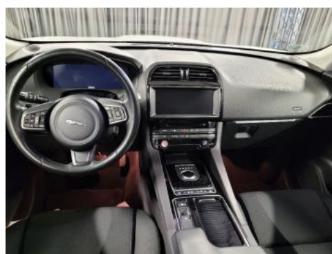
Fot. 12 Widok z tylnego siedzenia