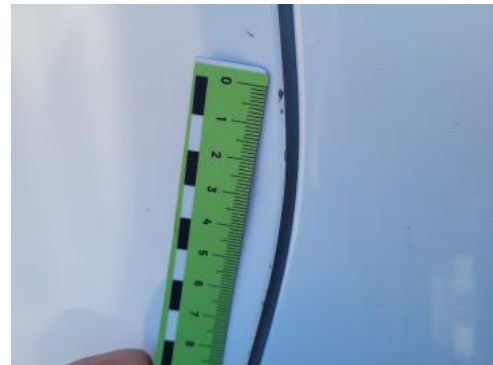
Fot. 42 Drzwi przednie lewe (Rysa/Odprysk 1)