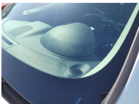
Fot. 29 Szyba czołowa (Zdjęcie poglądowe 1)