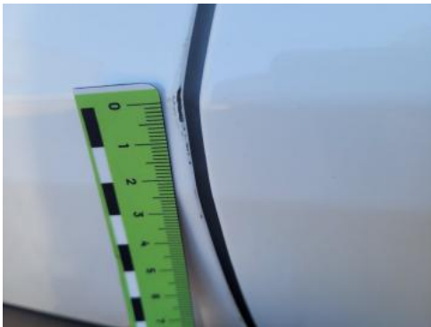
Fot. 41 Drzwi przednie lewe (Rysa/Odprysk)