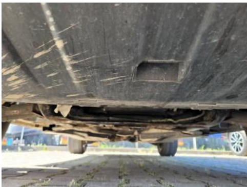
Fot. 19 Spód pojazdu przód