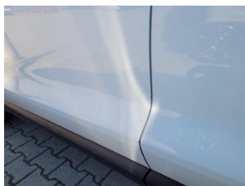
Fot. 40 Drzwi przednie lewe (Zdjęcie pogładowe 1)