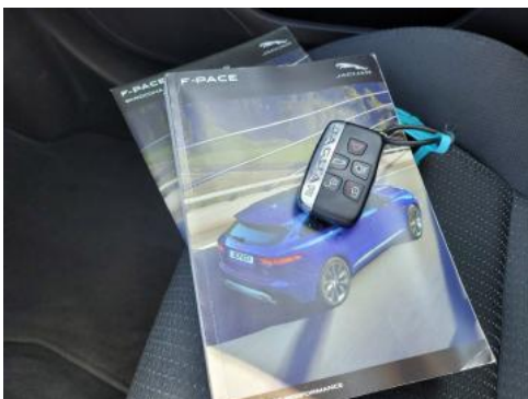
Fot. 23 Instrukcja obsługi