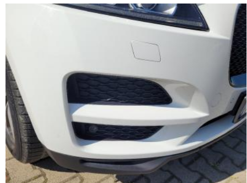
Fot. 24 Zderzak (Zdjęcie poglądowe 1)