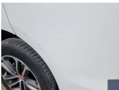
Fot. 31 Drzwi tylne prawe (Zdjęcie poglądowe 1)