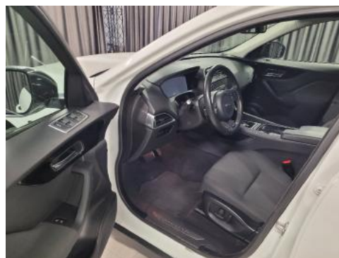
Fot. 10 Widok przez lewe przednie drzwi