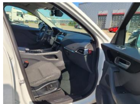
Fot. 46 _1