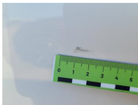
Fot. 38 Drzwi tylne lewe (Rysa/Odprysk)