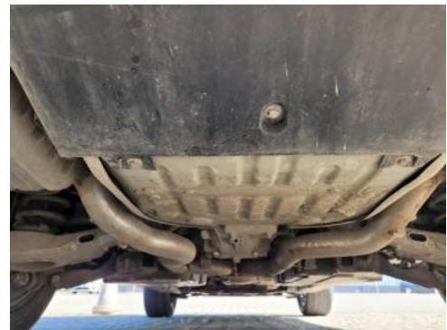
Fot. 20 Spód pojazdu tył