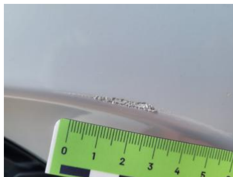
Fot. 26 Zderzak (Rysa/Odprysk)