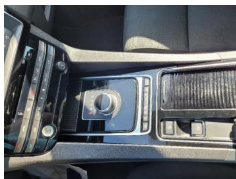
Fot. 14 Tunel środkowy