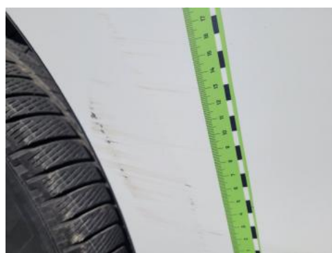
Fot. 32 Drzwi tylne prawe (Rysa/Odprysk)