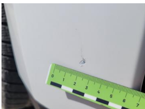
Fot. 27 Zderzak (Rysa/Odprysk 1)