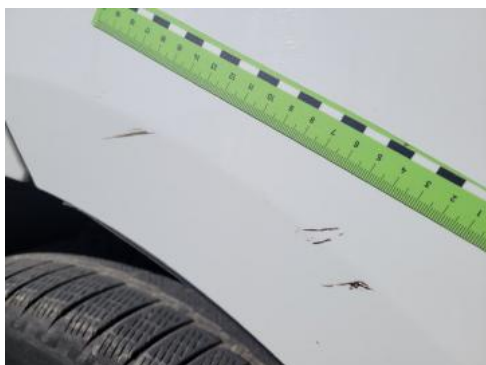
Fot. 33 Drzwi tylne prawe (Rysa/Odprysk 1)