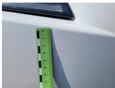
Fot. 28 Zderzak (Rysa/Odprysk 2)