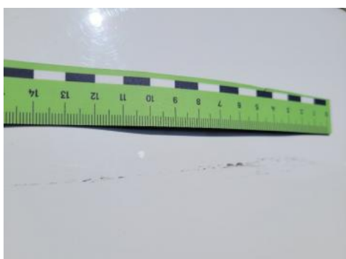
Fot. 35 Zderzak tylny (Rysa/Odprysk)