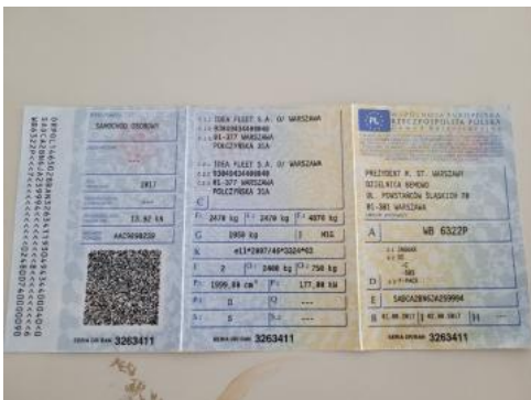
Fot. 21 Dowód rejestracyjny 1. strona