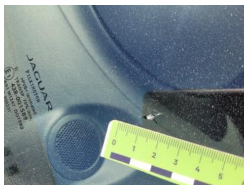
Fot. 30 Szyba czołowa (Pęknięcie/Rozerwanie)