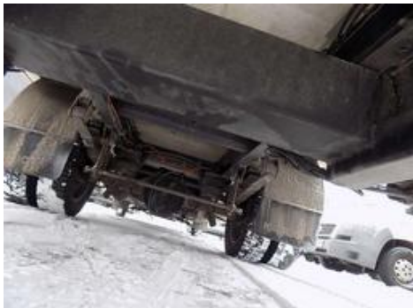
Fot. nr 61

Dokument wystawiony elektronicznie, wa ny bez podpisu