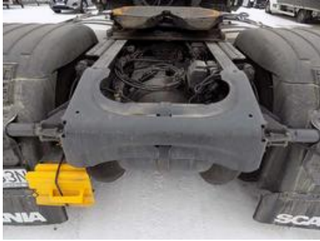
Fot. nr 46