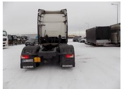
Fot. nr 54

Dokument wystawiony elektronicznie, wa ny bez podpisu