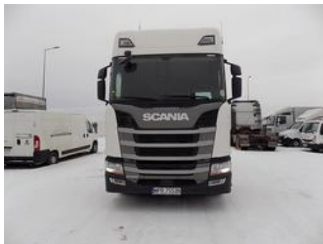
Fot. nr 53