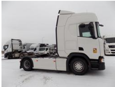
Fot. nr 50