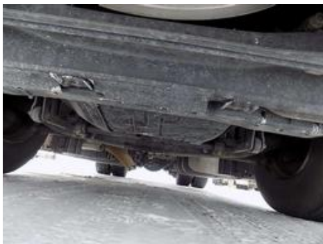
Fot. nr 52