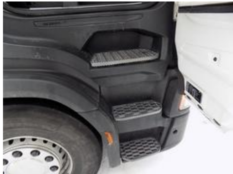
Fot. nr 38