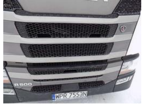
Fot. nr 33