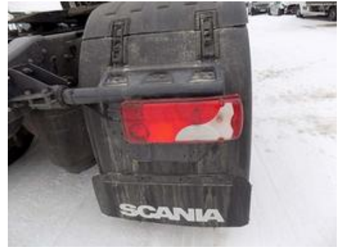
Fot. nr 45