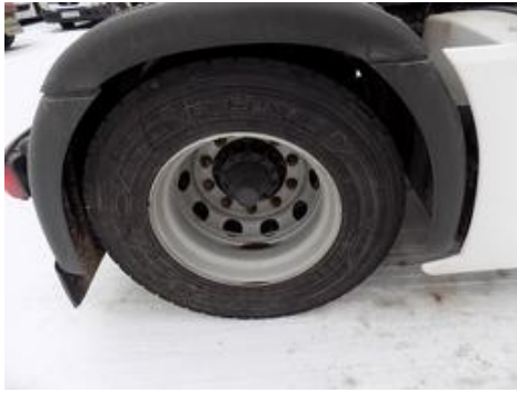
Fot. nr 43