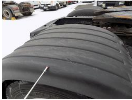
Fot. nr 44