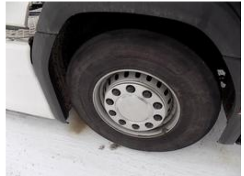
Fot. nr 39