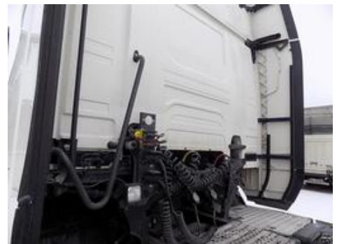
Fot. nr 27