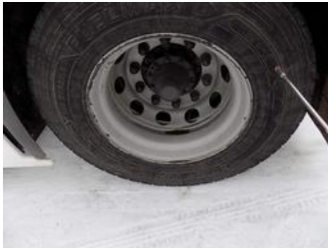
Fot. nr 49