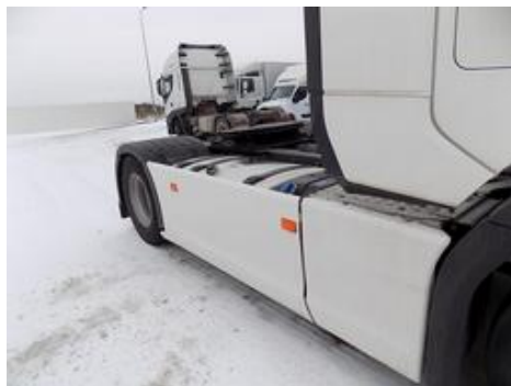
Fot. nr 41