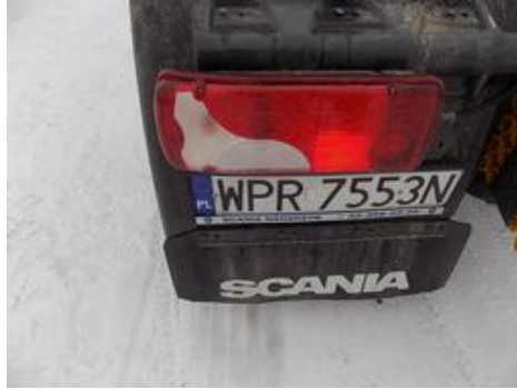
Fot. nr 47