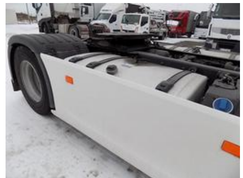
Fot. nr 42