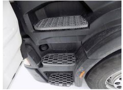
Fot. nr 30