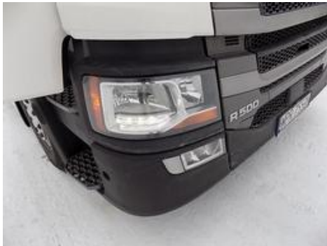
Fot. nr 34