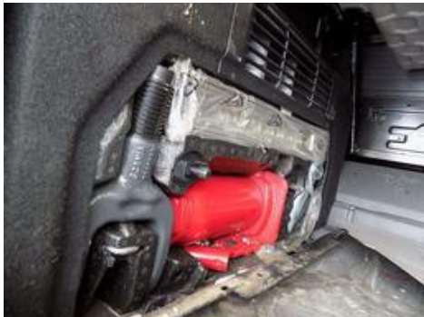
Fot. nr 37