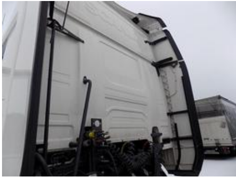
Fot. nr 28