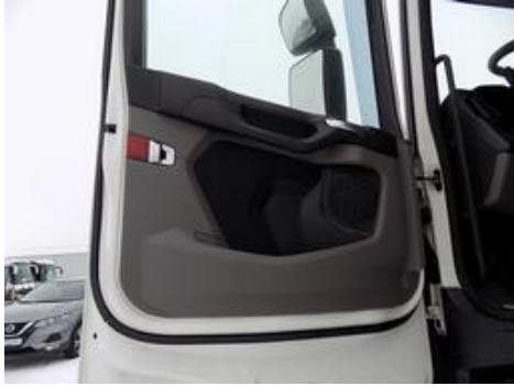
Fot. nr 31