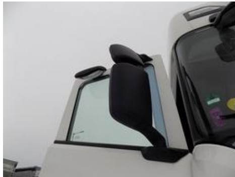
Fot. nr 35