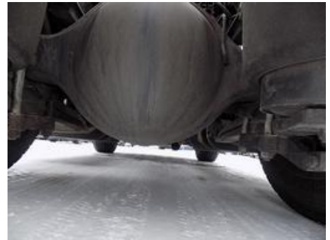
Fot. nr 51