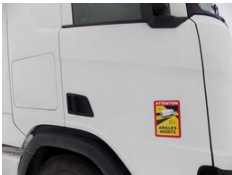
Fot. nr 40