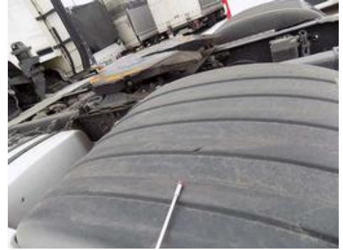
Fot. nr 48