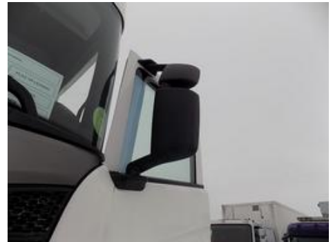
Fot. nr 36