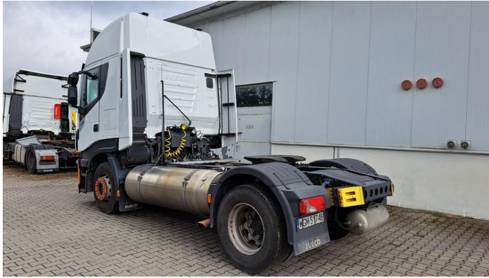
Fot. nr 7