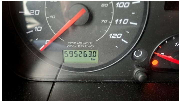
Fot. nr 14