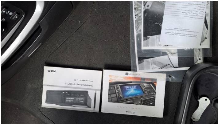
Fot. nr 25

Dokument wystawiony elektronicznie, ważny bez podpisu