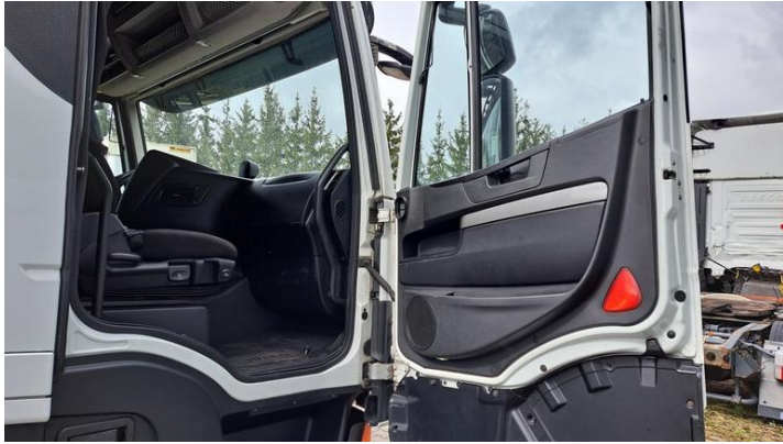
Fot. nr 11