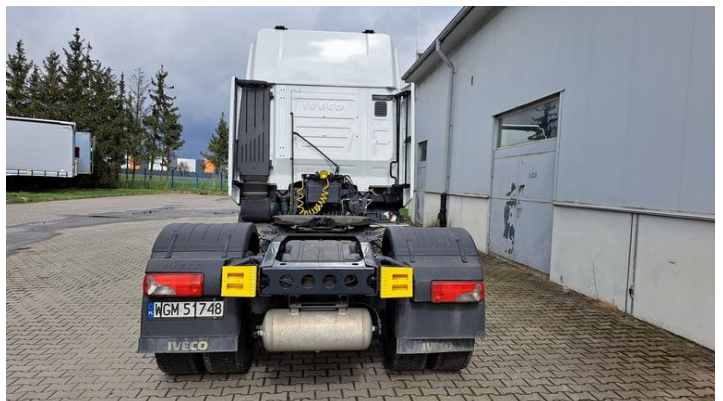
Fot. nr 6