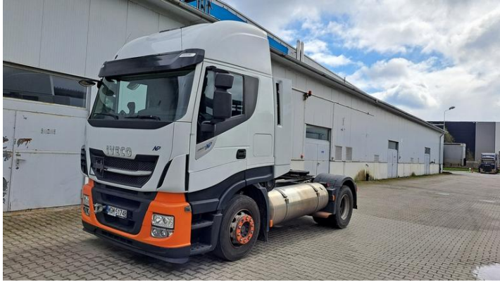
Fot. nr 1