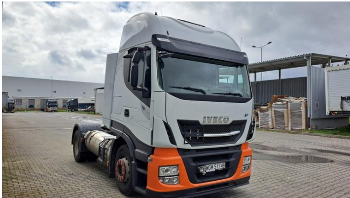
Fot. nr 3