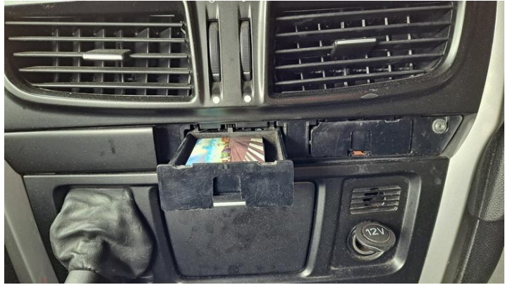
Fot. nr 16