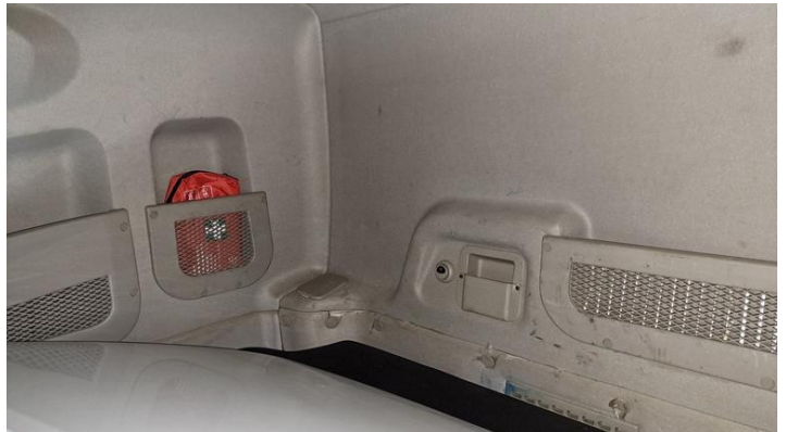
Fot. nr 18