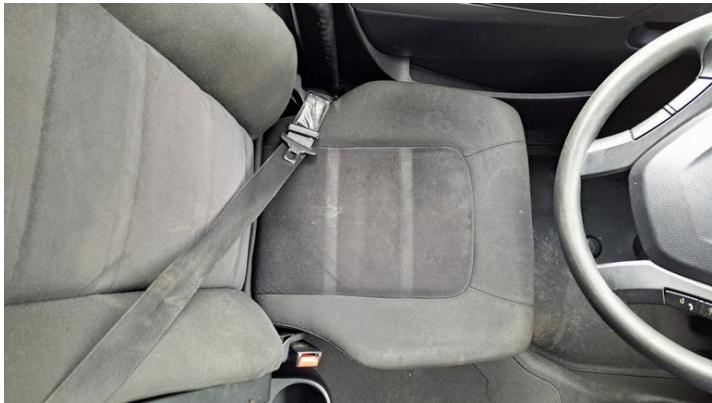
Fot. nr 21