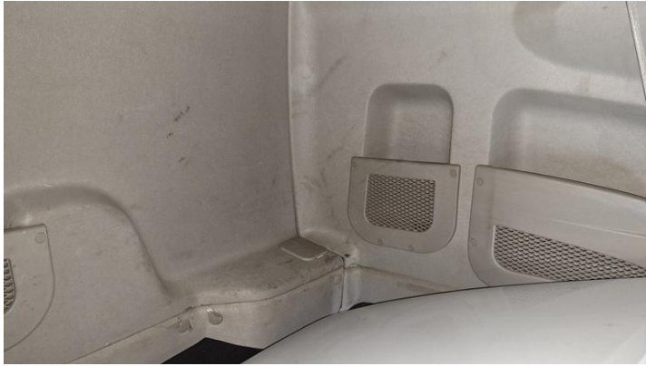
Fot. nr 19