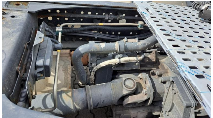
Fot. nr 4