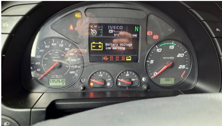
Fot. nr 13