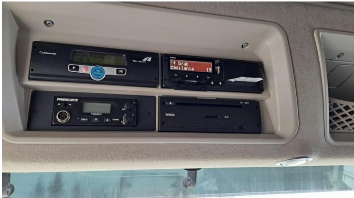
Fot. nr 17