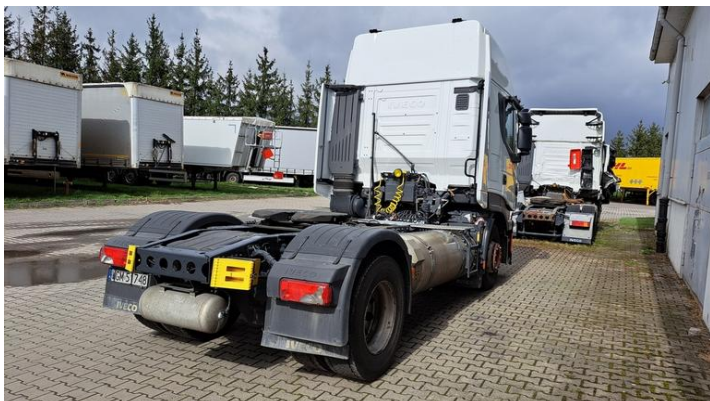
Fot. nr 5