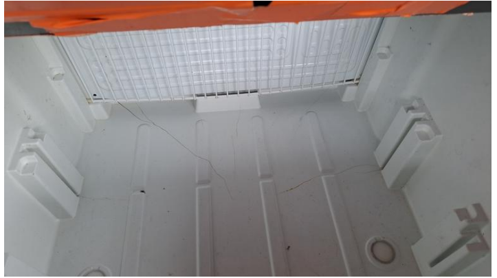
Fot. nr 24