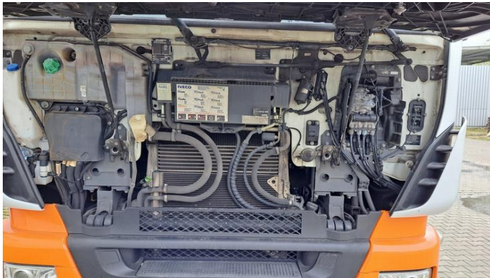
Fot. nr 9