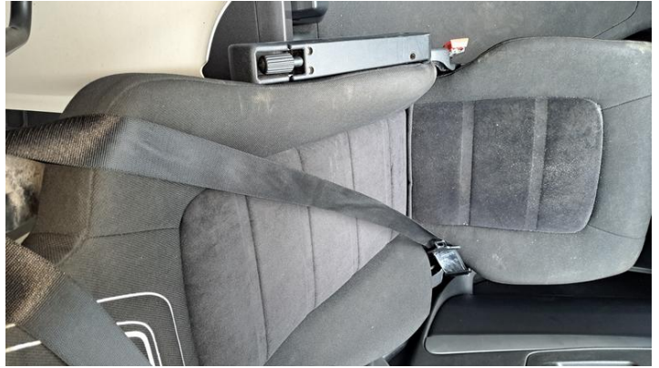
Fot. nr 20