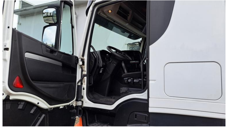
Fot. nr 12