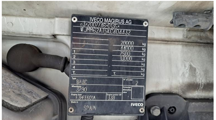
Fot. nr 10