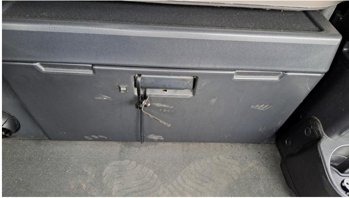
Fot. nr 23