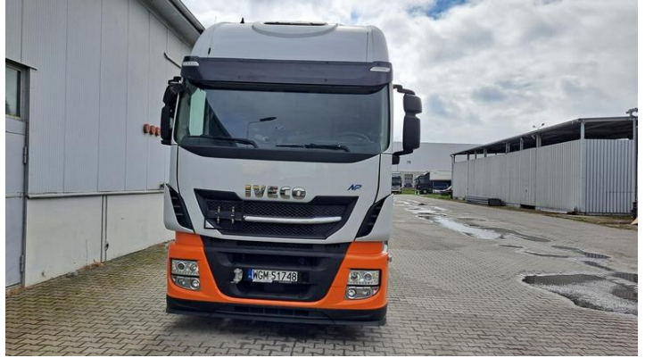
Fot. nr 2