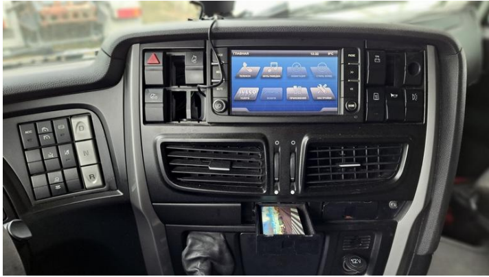
Fot. nr 15