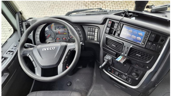
Fot. nr 22