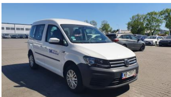
Fot. 3 Przekątna przednia prawa