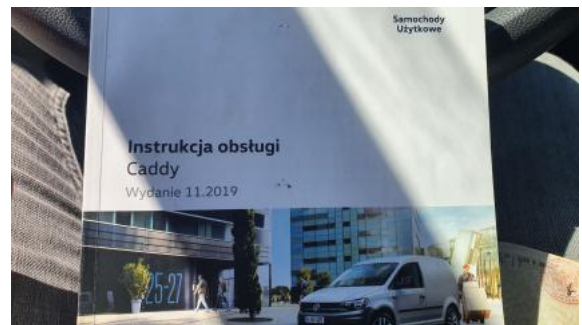
Fot. 30 Instrukcje