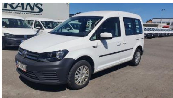
Fot. 1 Przekątna przednia lewa