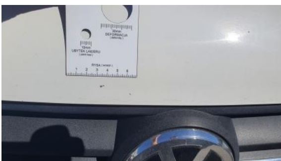
Fot. 31 Pokrywa komory silnika - Rysa/odprysk 1