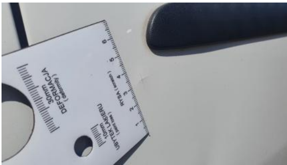
Fot. 41 Drzwi przed L() - Inne 3