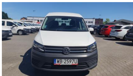
Fot. 2 Przód