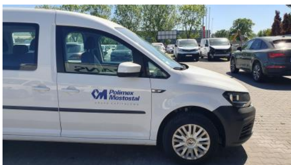
Fot. 5 Bok prawy z przodu