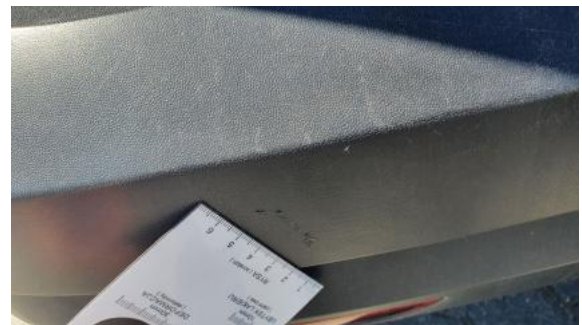
Fot. 36 Zderzak tylny - Rysa/odprysk 1