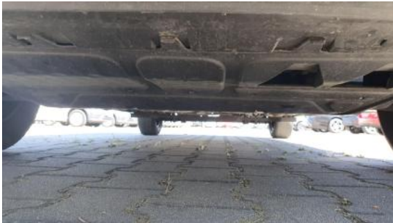
Fot. 25 Spód pojazdu przód