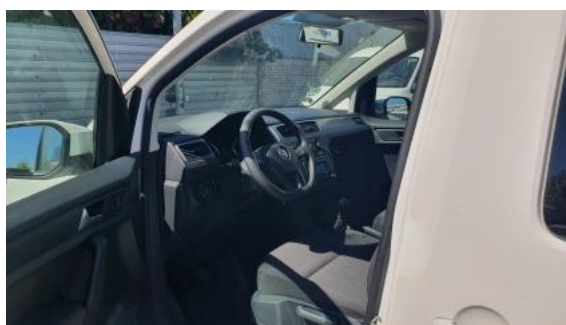
Fot. 16 Widok przez otwarte drzwi przednie lewe