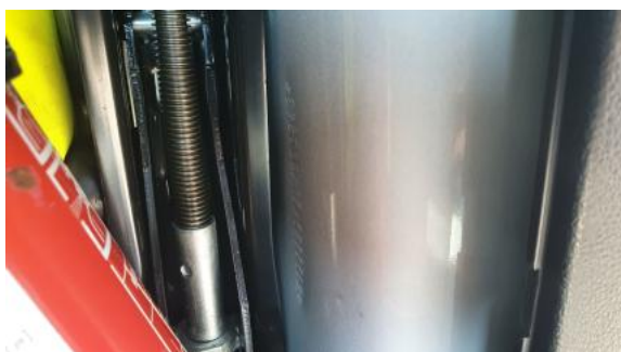
Fot. 13 Numer identyfikacyjny