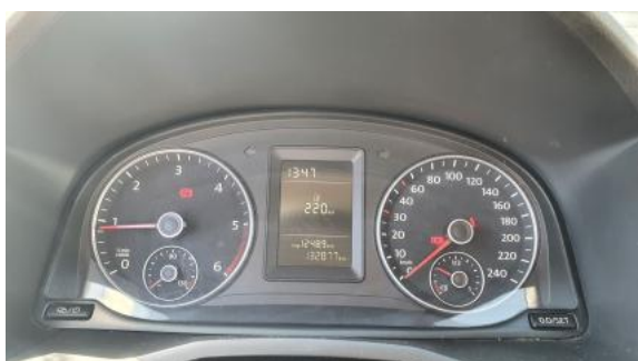
Fot. 15 Zestaw wskaźników - przebieg