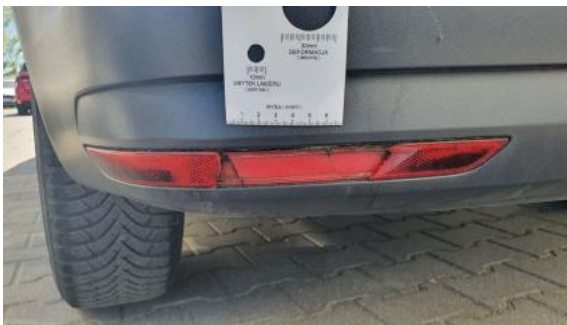
Fot. 35 Światło odblaskowe tylne - Pęknięcie/rozerwanie 1