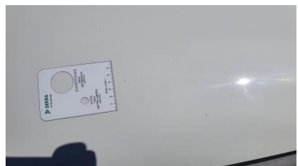
Fot. 32 Pokrywa komory silnika - Rysa/odprysk 2