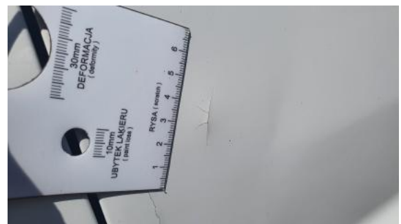
Fot. 40 Drzwi przed L - Inne 2