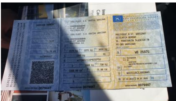
Fot. 27 Dowód rej. Str. 1