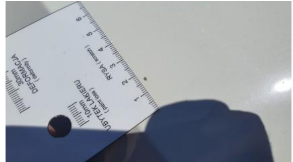
Fot. 34 Pokrywa komory silnika - Inne 1