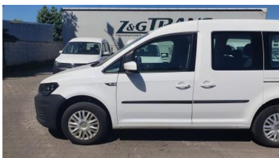
Fot. 11 Bok lewy z przodu