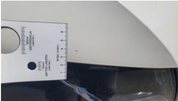
Fot. 33 Pokrywa komory silnika() - Rysa/odprysk 3