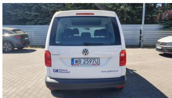
Fot. 8 Tył