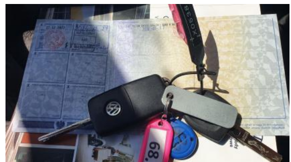
Fot. 28 Dow. Rej. Str.2 i klucze