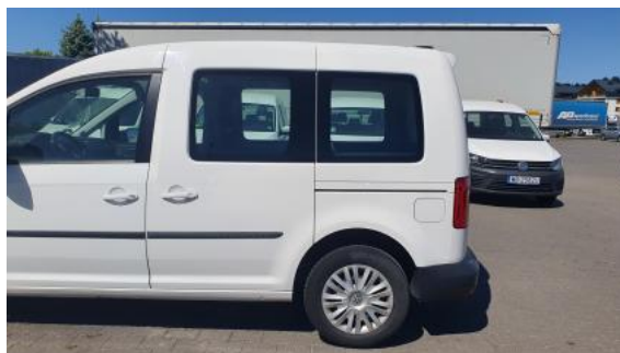
Fot. 10 Bok lewy z tyłu