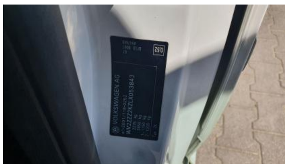
Fot. 14 Tabliczka znamionowa