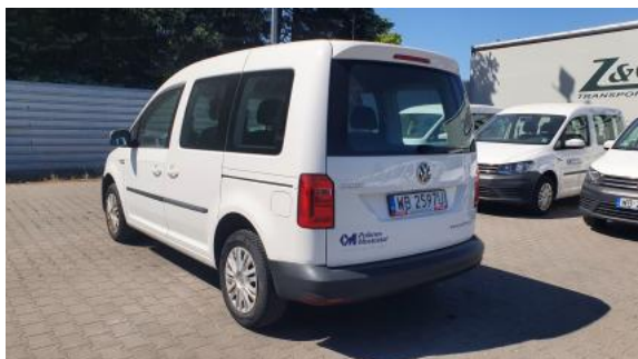
Fot. 9 Przekątna tylna lewa