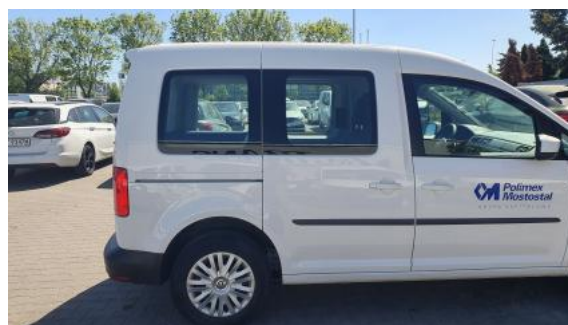
Fot. 6 Bok prawy z tyłu