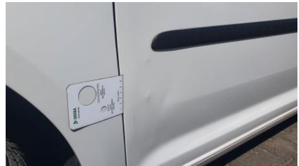
Fot. 38 Drzwi przed L - Wgniecenie/odkształcenie 1