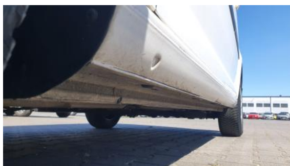
Fot. 12 Próg lewy (widok od przodu)