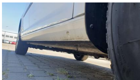
Fot. 4 Próg prawy (widok od przodu)