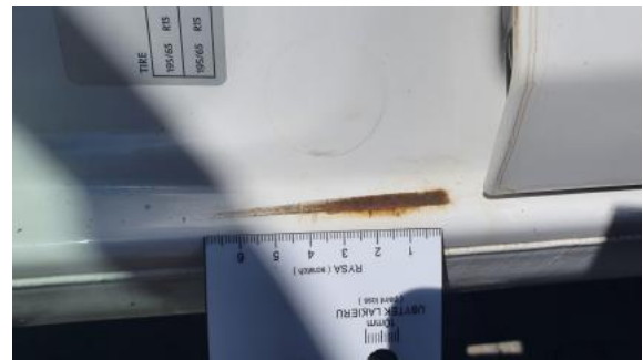
Fot. 42 Próg L - Inne 1