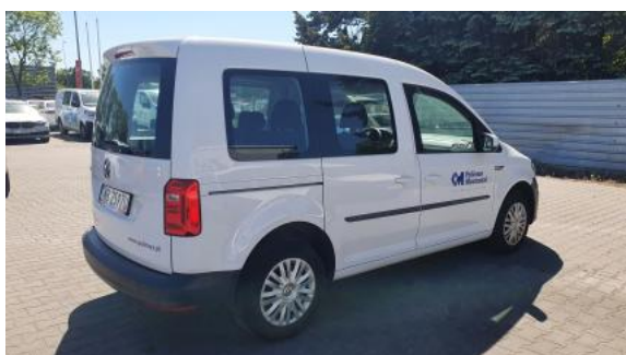
Fot. 7 Przekątna tylna prawa