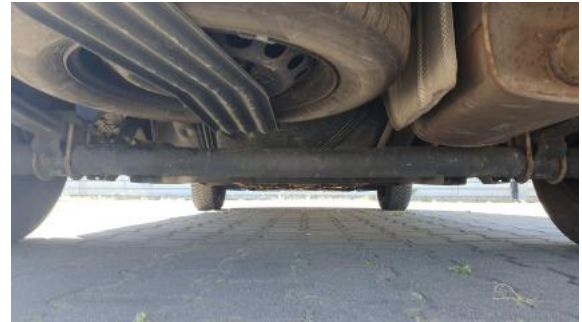
Fot. 26 Spód pojazdu tył