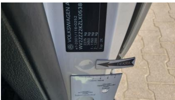
Fot. 43 Słupek środkowy L - Wgniecenie/odkształcenie 1