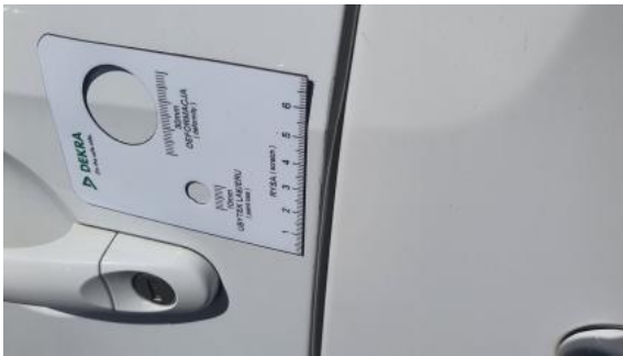
Fot. 37 Drzwi przed L - Rysa/odprysk 1