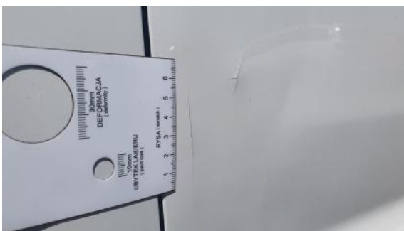
Fot. 39 Drzwi przed L - Inne 1