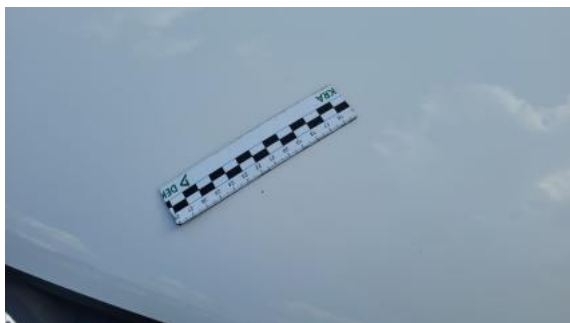
Fot. 33 Pokrywa komory silnika - Rysa/odprysk 1