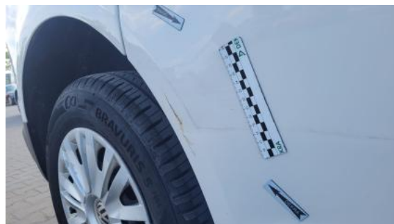
Fot. 34 Drzwi tylne P - Wgniecenie/odkształcenie 1