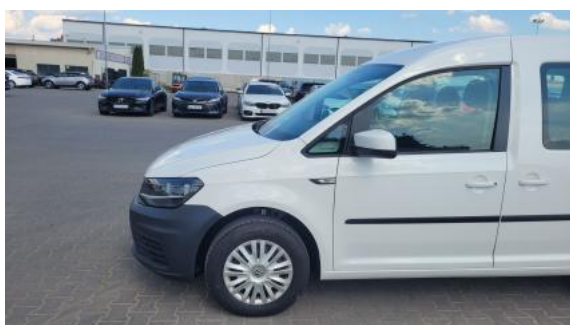
Fot. 11 Bok lewy z przodu