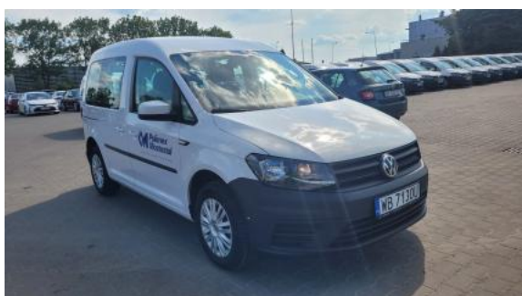
Fot. 3 Przekątna przednia prawa