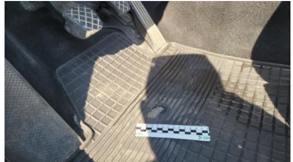
Fot. 42 Dywanik prze L - Pęknięcie/rozerwanie 1