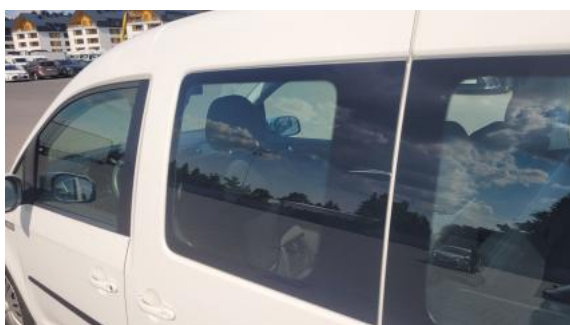
Fot. 39 Szyba boczna środkowa L - zdjęcie poglądowe 1