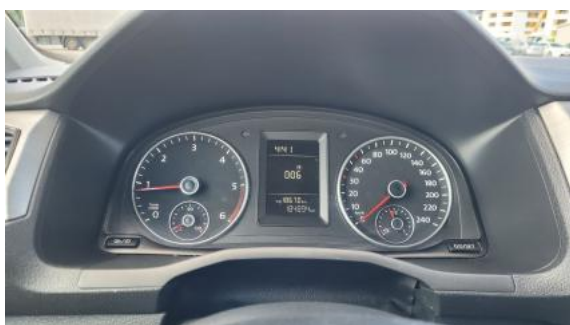
Fot. 15 Zestaw wskaźników - przebieg