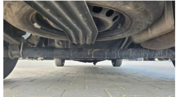
Fot. 26 Spód pojazdu tył