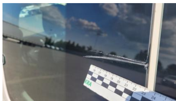
Fot. 40 Szyba boczna środkowa L - Rysa/odprysk 1