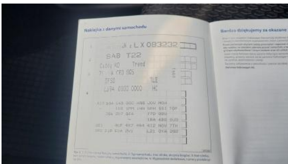
Fot. 29 Książka serwisowa – dane