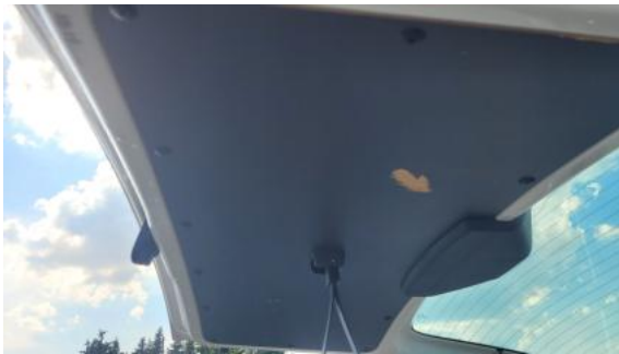
Fot. 45 Wykładzina pokrywy tylnej - Rysa/odprysk 1