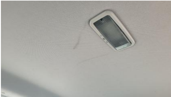
Fot. 41 Podsufitka - Inne 1