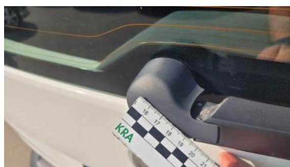
Fot. 36 Ramię wycieraczki tylnej - Pęknięcie/rozerwanie 1