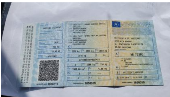
Fot. 27 Dowód rej. Str. 1