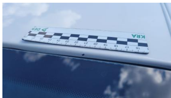
Fot. 38 Dach - Rysa/odprysk 1