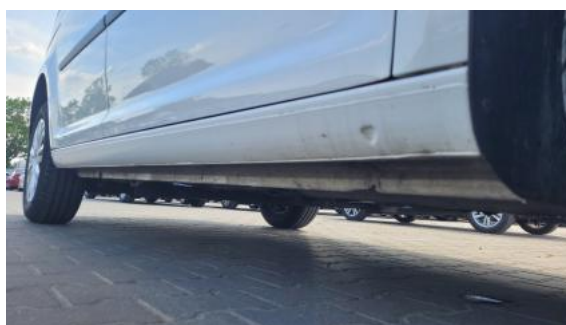
Fot. 4 Próg prawy (widok od przodu)