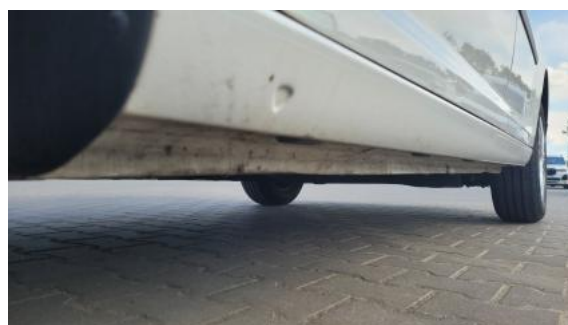
Fot. 12 Próg lewy (widok od przodu)