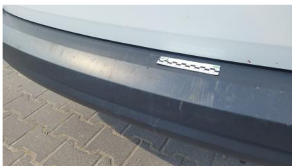
Fot. 37 Zderzak tylny - Rysa/odprysk 1