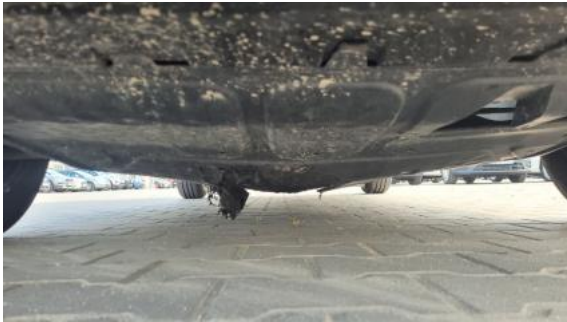
Fot. 25 Spód pojazdu przód