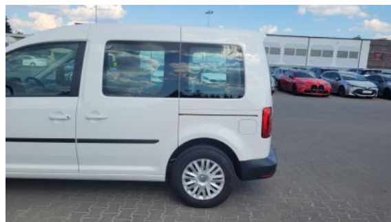
Fot. 10 Bok lewy z tyłu