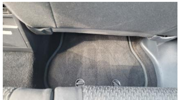
Fot. 44 Dywanik tyl P - Inne 1