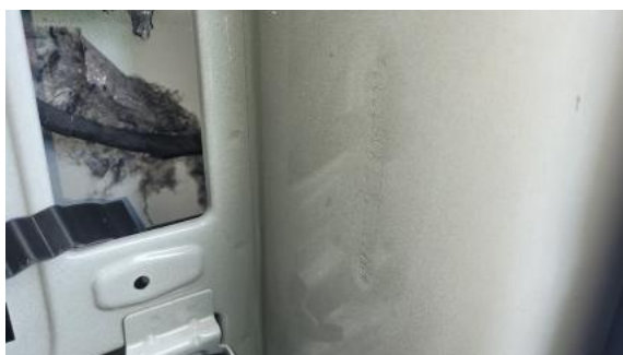
Fot. 13 Numer identyfikacyjny