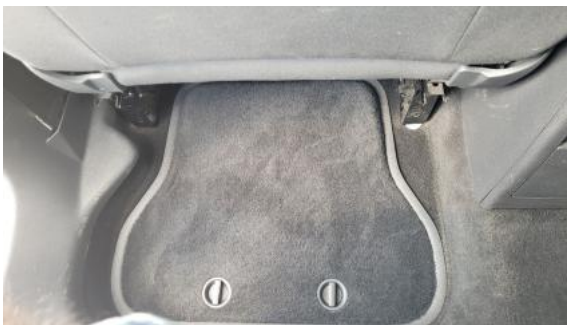
Fot. 43 Dywanik tyl L - Inne 1