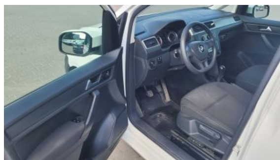
Fot. 16 Widok przez otwarte drzwi przednie lewe