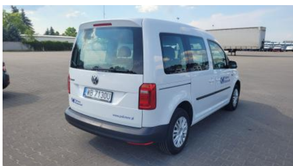
Fot. 7 Przekątna tylna prawa