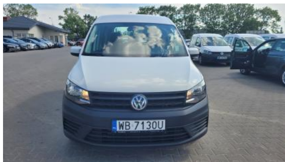
Fot. 2 Przód