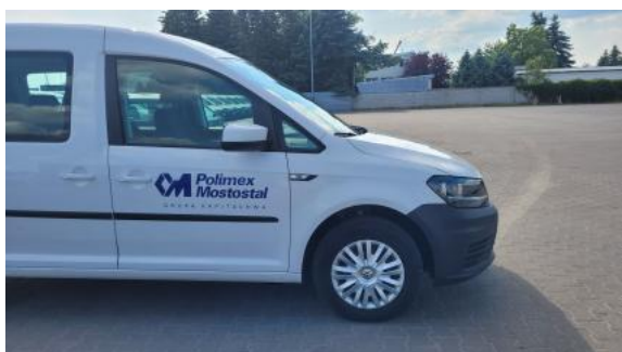
Fot. 5 Bok prawy z przodu