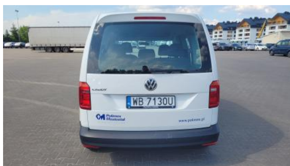
Fot. 8 Tył