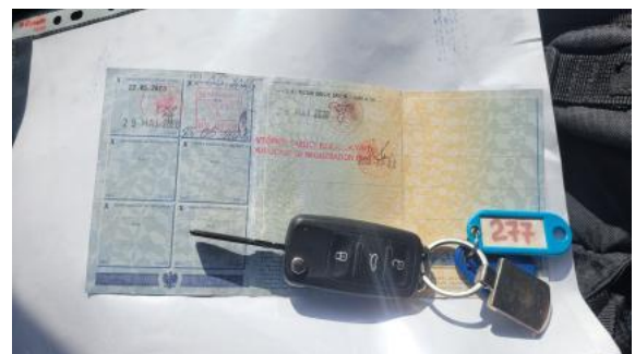
Fot. 28 Dow. Rej. Str.2 i klucze