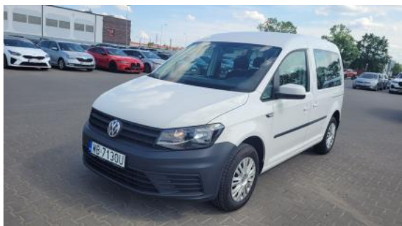
Fot. 1 Przekątna przednia lewa