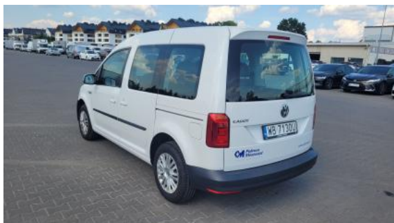
Fot. 9 Przekątna tylna lewa