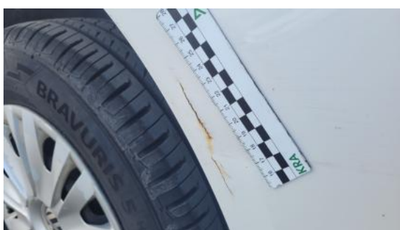
Fot. 35 Drzwi tylne P - Inne 1