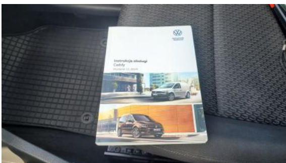
Fot. 31 Instrukcje