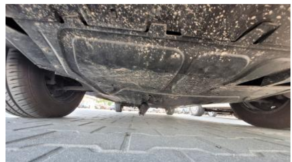
Fot. 32 Ostona dolna silnika - Pęknięcie/rozerwanie 1