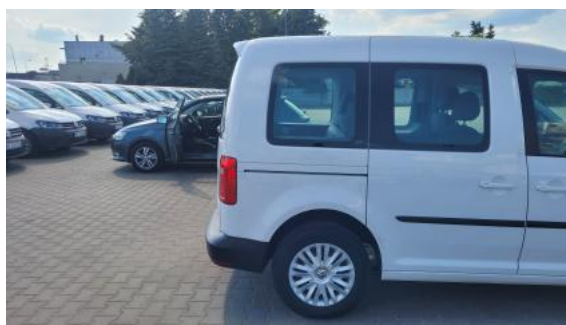
Fot. 6 Bok prawy z tyłu