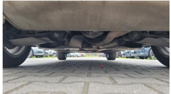
Fot. 26 Spód pojazdu tył