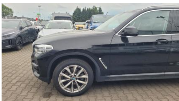
Fot. 11 Bok lewy z przodu