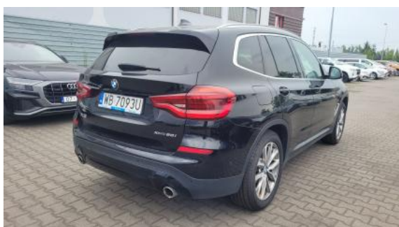
Fot. 7 Przekątna tylna prawa