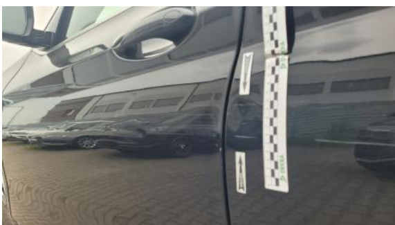
Fot. 45 Drzwi tylne L - Wgniecenie/odkształcenie 1