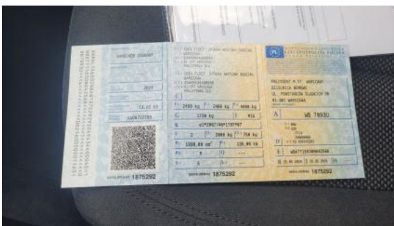
Fot. 31 Dowód rej. Str. 1