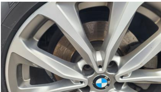
Fot. 27 Tarcza hamulcowa przednia lewa