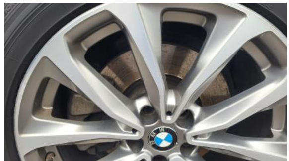
Fot. 28 Tarcza hamulcowa przednia prawa