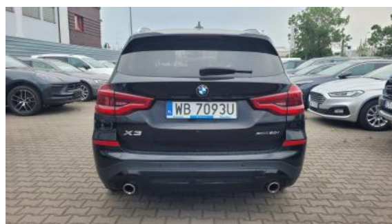
Fot. 8 Tył