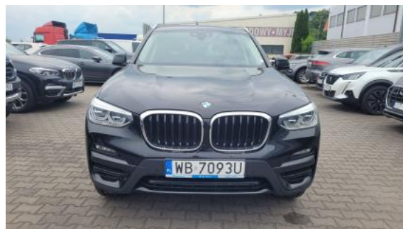
Fot. 2 Przód