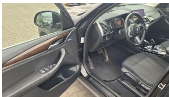
Fot. 16 Widok przez otwarte drzwi przednie lewe