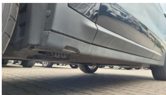
Fot. 12 Próg lewy (widok od przodu)