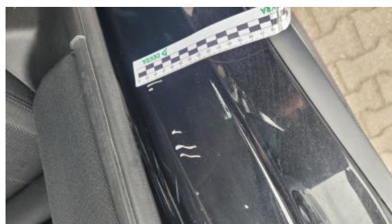
Fot. 40 Błotnik tylny P / Ściana boczna P - Rysa/odprysk 1