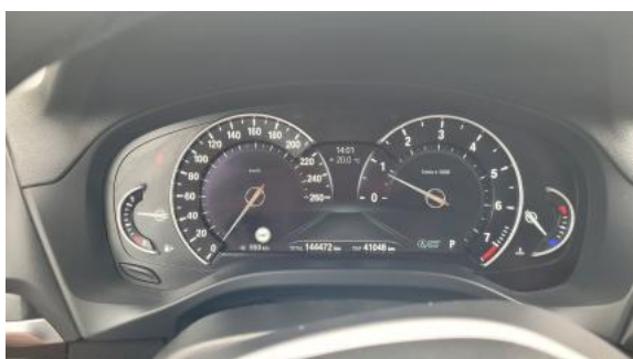
Fot. 15 Zestaw wskaźników - przebieg