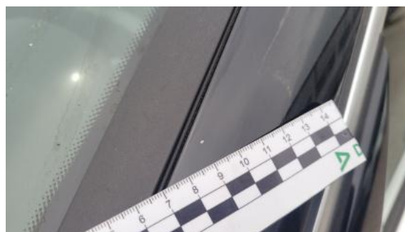
Fot. 46 Słupek przedni L - Rysa/odprysk 1