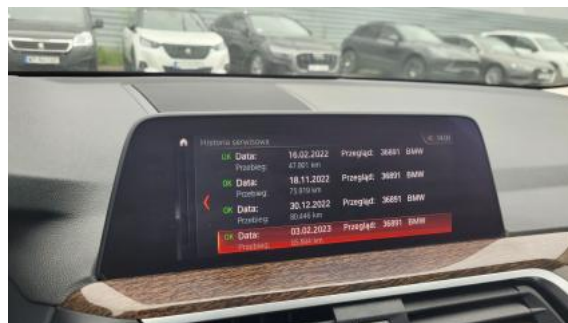
Fot. 34 Książka serwisowa – ostatni przegląd