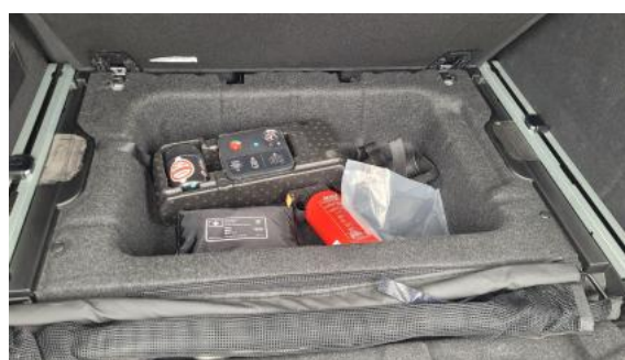
Fot. 36 Zestaw naprawczy koła