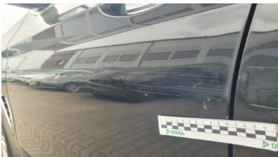
Fot. 41 Drzwi przed L - Rysa/odprysk 1