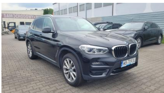
Fot. 3 Przekątna przednia prawa