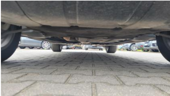
Fot. 25 Spód pojazdu przód