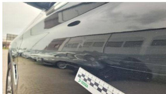
Fot. 42 Drzwi przed L - Wgniecenie/odkształcenie 1