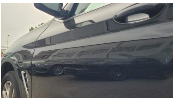
Fot. 43 Drzwi przed L - Wgniecenie/odkształcenie 2