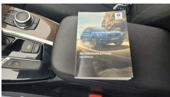
Fot. 35 Instrukcje