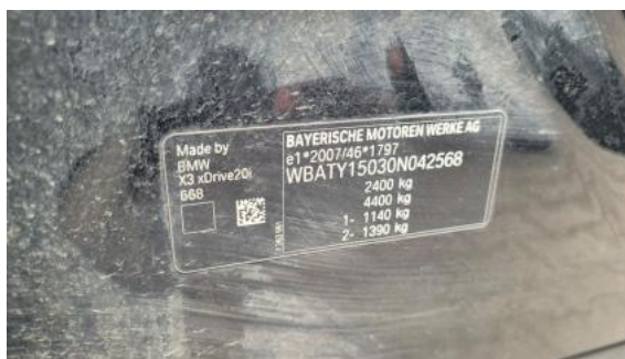
Fot. 14 Tabliczka znamionowa