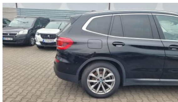
Fot. 6 Bok prawy z tyłu