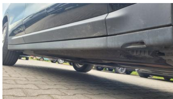
Fot. 4 Próg prawy (widok od przodu)