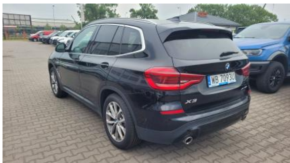
Fot. 9 Przekątna tylna lewa