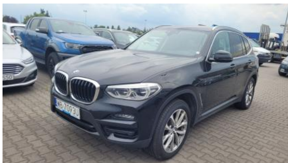
Fot. 1 Przekątna przednia lewa