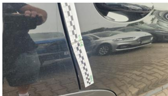
Fot. 38 Drzwi tylne P - Rysa/odprysk 1