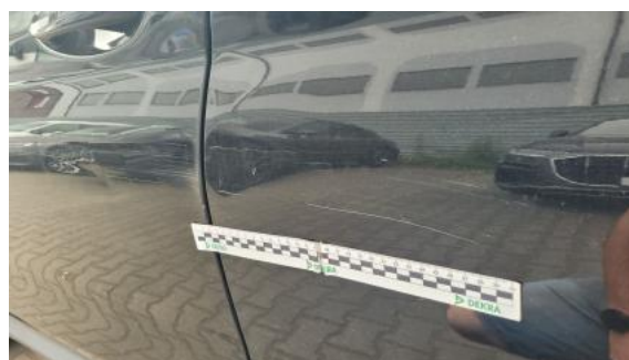
Fot. 44 Drzwi tylne L - Rysa/odprysk 1