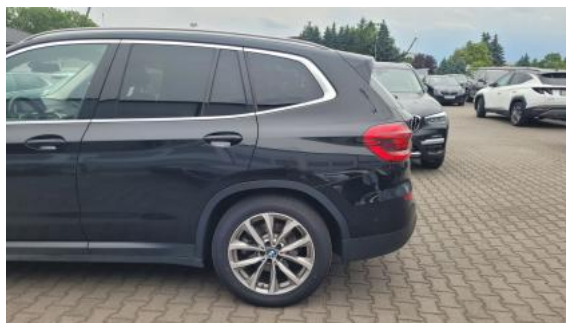
Fot. 10 Bok lewy z tyłu