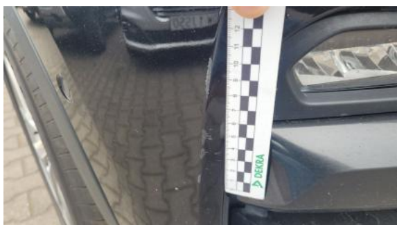
Fot. 37 Zderzak - Rysa/odprysk 1