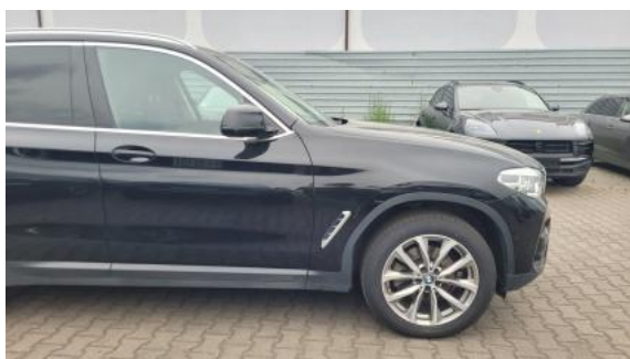
Fot. 5 Bok prawy z przodu