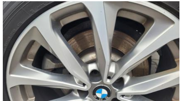
Fot. 30 Tarcza hamulcowa tylna lewa