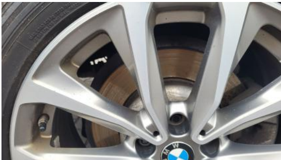
Fot. 29 Tarcza hamulcowa tylna prawa