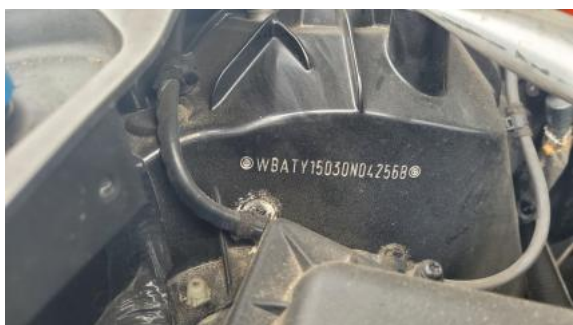
Fot. 13 Numer identyfikacyjny