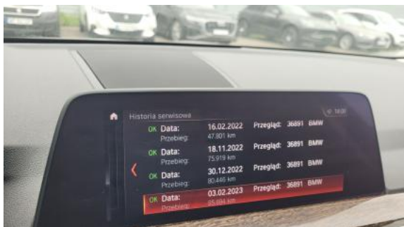
Fot. 33 Książka serwisowa – dane