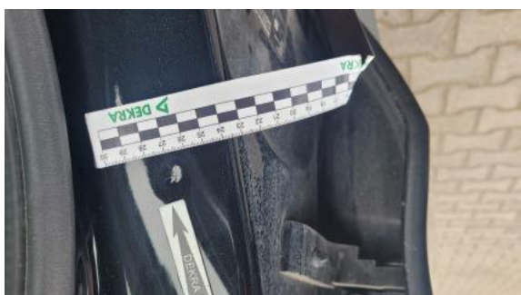
Fot. 39 Słupek środkowy P - Wgniecenie/odkształcenie 1